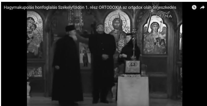
Az ortodoxia vidrăușegi szentélyében

Ezt követően kezdtem kutakodni, tényeket gyűjteni az ortodox egyház székelyföldi terjeszkedéséről, szólásra bírni egyházfőket, papokat, szerzeteseket, vallástörténészt, szociológust. Kínkeserves feladat volt, hiszen legszívesebben azt mondaná az ember: nőjön szabadságában a hit, éljen jogával az egyház. Még a székely atyafinak is igaza van: inkább templomba, mint kocsmába járjon a nép. A nép viszont a hegyeken túlról jön és települ be az új templomok köré, hogy a színmagyar területekre bevándorolva megteremtse a nemzetállami többséget. Ráadásul itt vallási szándék és össznemzeti, avagy hatalmi