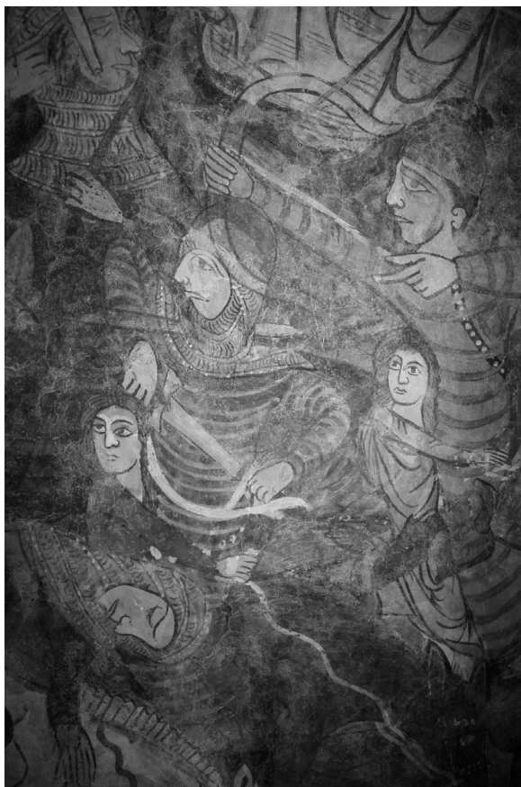
Bögöz, református templom (részlet)

hol van a határa annak, ami ellen még tehetek valamit, és mit mérgez meg véglegesen a puszta lényem, mikor vagyok jó, miért voltam én rossz, hogy ennyi büntetést kell eltűrjek egyhuzamban.