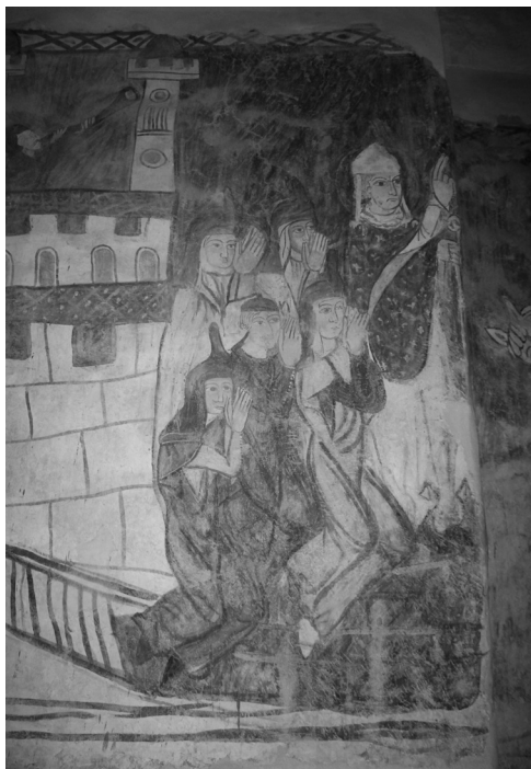
Bögöz, református templom (részlet)