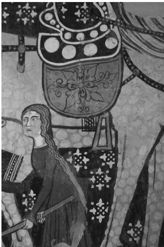
Székelyderzs, unitárius templom (részlet)

A kötetben foglalt és értékelt egyéni teljesítmények tükrében óhatatlanul kirajzolódik egy kép a kortárs erdélyi próza egy szegmenséről, amely színes és eklektikus, mélyenszántó és humoros, olvasmányos és szerethető, akárcsak Zsidó Ferenc kritikái. Végezetül, visszadobom a labdát a szerzőnek, várjuk a további írásokat, és természetesen: „Csak egyenesen!”