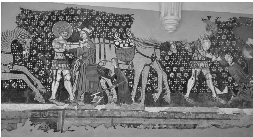
Székelyderzs, unitárius templom (részlet)