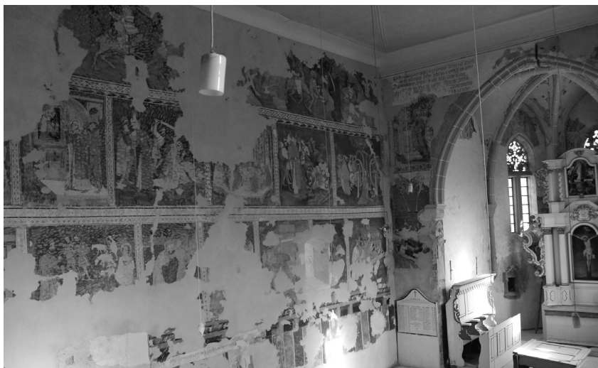
Szászivánfalva, evangélikus templom (részlet)

Az imént vázolt rekonstrukció csupán néhány évvel hozza időben előrébb a székelyek bihari csoportjának Erdélybe telepítését – 1098 helyett az 1091 utáni évek kerülnek így előtérbe –, nagy előnye viszont, hogy megteremti az eddig hiányzó kapcsolatot Szent László személye és a székelység – legalább egy nagyobb csoportja – között, mégpedig egy olyan esemény kapcsán, melynek hagyománya élhetett a 14. század közepi Váradon.