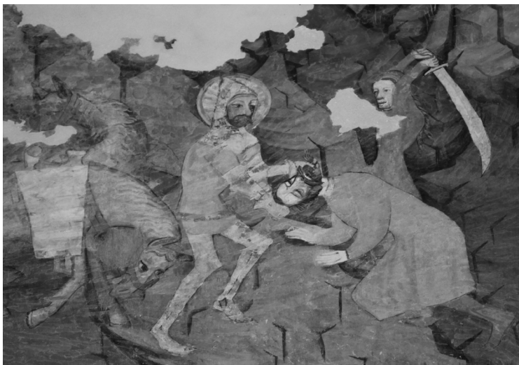
Szászivánfalva, evangélikus templom (részlet)

Én csendben szégyelltem magamat, hogy megint elhamarkodottan ítélkeztem, te pedig óvatosan átöleltél, s finoman eresztetted szemfogaidból a véralvadástgátlót meleg, lüktető nyakamba.