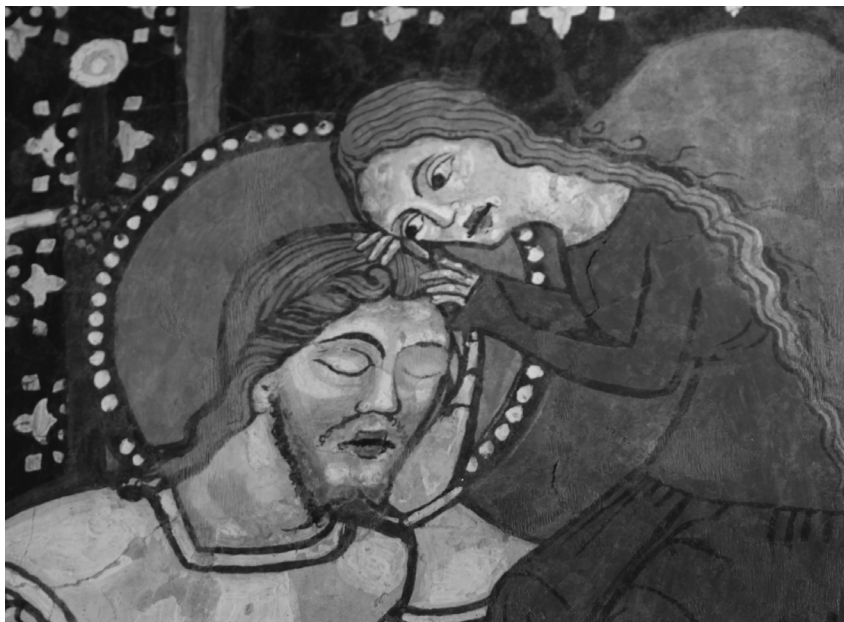
Szekelyderzs, unitárius templom (részlet)

Pléh Csaba: (2008) A lélek és a lélektan örömei . Gondolat Kiadó, Budapest.