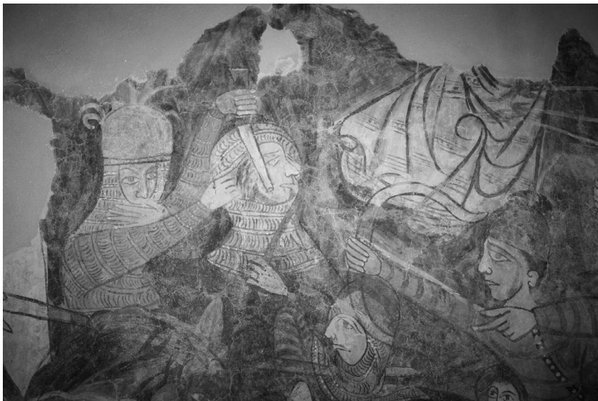
Bögöz, református templom (részlet)