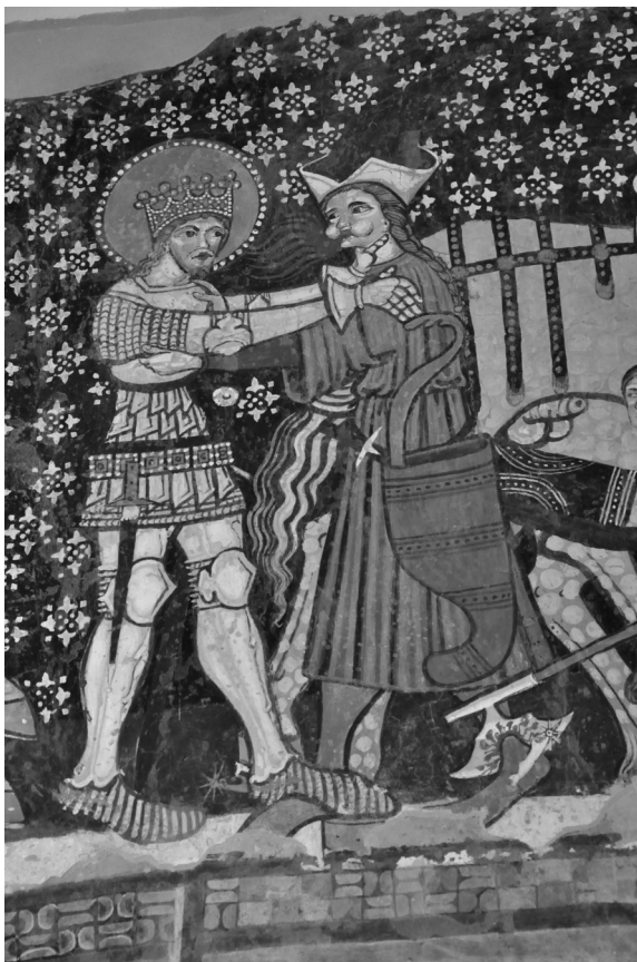
Székelyderzs, unitárius templom (részlet)

csenkolt fenyő magasul. Hagyja az erdő, szelíden egybegyűjtve a rejtélyesen kibogárzó színekkel, a vakító ragyogással. Együtt van mindez vele, nincs külön. Ezt tanítja nekem ő, az erdő.