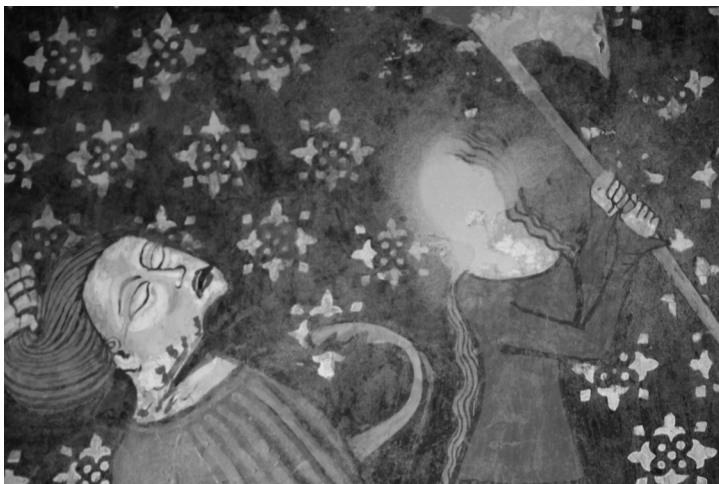
Székeltyderzs, unitárius templom (részlet)

Gomolyognak a muslicák. Elszédülnek, beleölik magukat. Dél van, ők ketten az utolsók. Egy szőke lány és egy tizéves fiúcska. Lise? Charlotte? A lánya? Szent Aldegonde oltára előtt adja őket össze a pap.