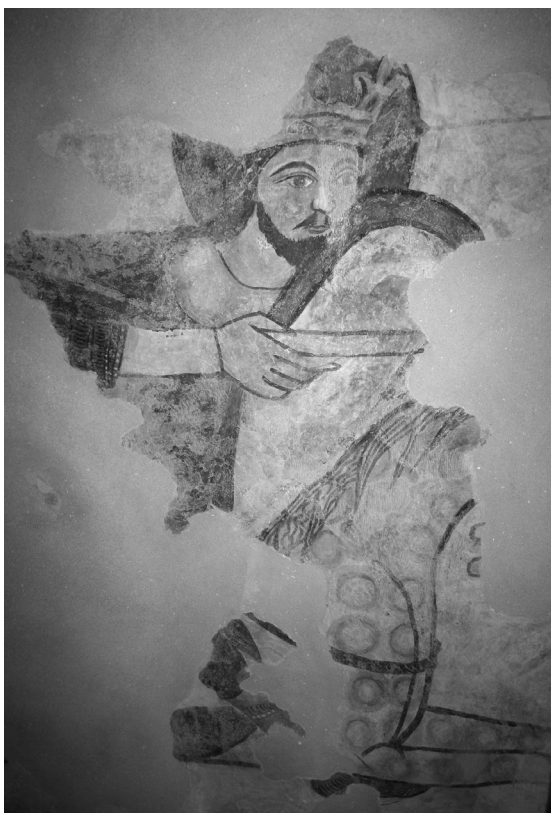
Bögöz, református templom (részlet)

Ne hunyd le szemed, korán van még ahhoz, meglélned ébren kell azt az órát. Visszafordítani, lenne-e, mondd, erőd a démon szemébe köpni?