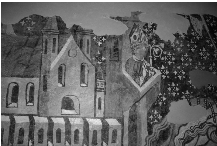
Székelyderzs, unitárius templom (részlet)

A kiadás költségeit a Gyergyószentmiklói Közbirtokosság támogatta.