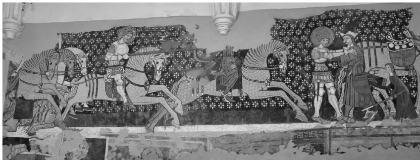
Székelyderzs, unitárius templom (részlet)