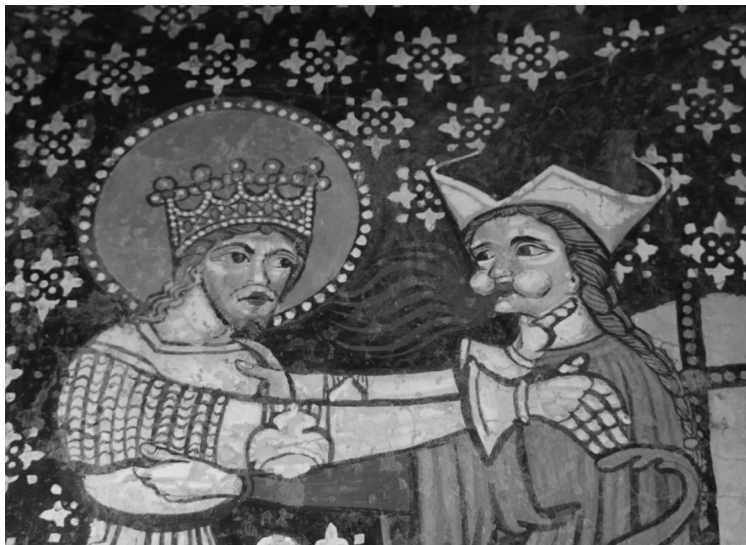
Székelyerzs, unitárius templom (részlet)