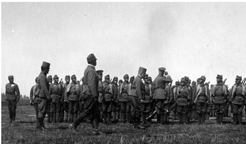
A 38. rohamászlóalj (Székely Nemzeti Múzeum, Sepsiszentgyörgy)

gránátszakókat viselnek, M. Christian Ortner szerint ezek nem bizonyultak túl népszerűnek a harctéren: mivel meglehetősen világos anyagból készültek, kiváló célpontot kínáltak az ellenségnek, ráadásul a kézigránátokat sem lehetett gyorsan elővenni belőlük, így a katonák inkább nem használták őket, a gránátokat pedig egyszerűen csak az övükbe tűzték.