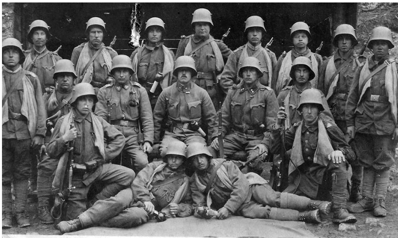
Osztrák–magyar rohamcsapatok katonái a jellegzetes gránátzsákokkal

időszaka, ilyenkor ugyanis az első hullámba tartozó katonák, akik a betörést végrehajtották, többnyire továbbhaladtak és elérték a számukra kitűzött célt, azonban a második hullám embereinek, akik leragadtak az árkok megtisztításáért vívott közelharcban, még nem sikerült felzárkózni rájuk, így az első hullámba tartozóknak, akik nem képviseltek jelentősebb erőt, magukra maradvá kellett szembenézniük az esetleges ellentámadásokkal. 45