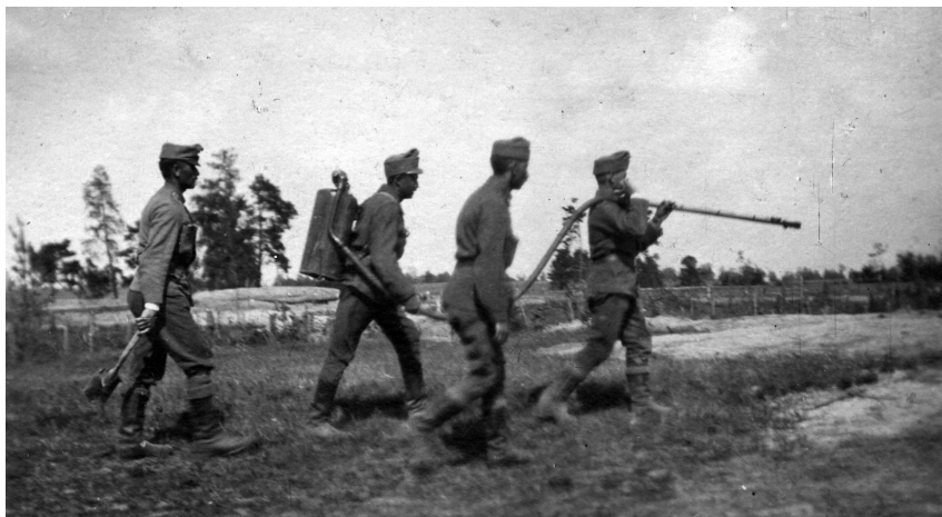
Lángszórósok. A fotó feltehetően a 38. hadosztály embereiről készült. (Székely Nemzeti Múzeum, Sepsiszentgyörgy)