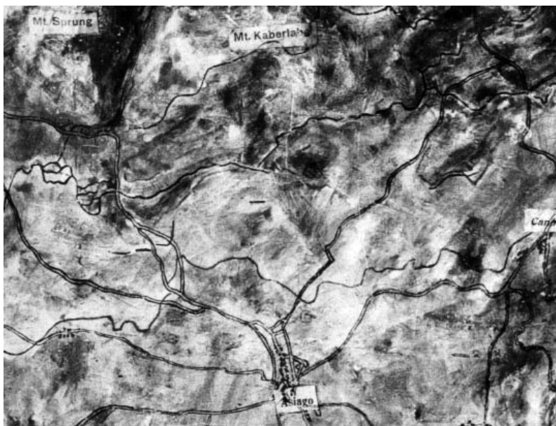
A támadás előkészítéséhez használt terepasztal részlete a támadási területtel (Székely Nemzeti Múzeum, Sepsiszentgyörgy)

a legutóbbi nyugati offenzívák tapasztalatait dolgozta fel, Géczy azonban hiába szerette volna a rohamszázad- és rohamjárőr-parancsnokokkal szemrevételezni a valóságos betörési helyeket, hogy az akadályrobbantásokat kellőképpen előkészíthesse, illetve hogy a tüzérség parancsnokaival részletesen megbeszélhesse az együttműködés részleteit, javaslata süket fülekre talált, mi több, a horvát rohamzászlóaljat, amellyel együttesen készítették elő a támadást, hirtelen más feladatra vezényelték. „Nyilvánvaló bizonyítéka volt ez az intézkedés annak – írja meglehetősen higgadtan ahhoz képest, hogy katonaként bizonyára keserűség tölthette el, amikor a parancsot megkapta –, hogy egyes osztrák–magyar vezetők még akkor, 1918 közepén sem voltak tisztában a nyugati jellegű rohamharcászati alapelveivel!” 82