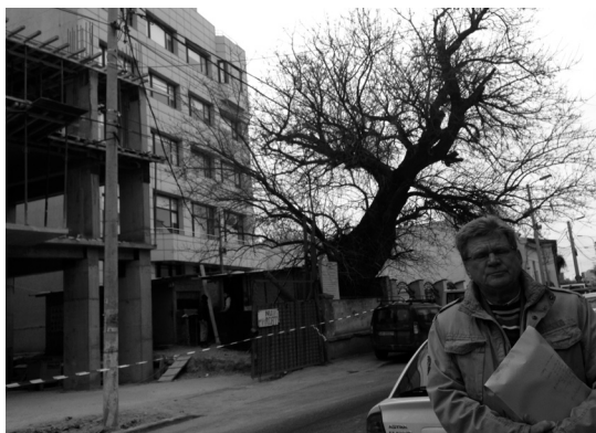
A szerző a „Costică” dossziéval a kezében (Bukarest, 2015. április)