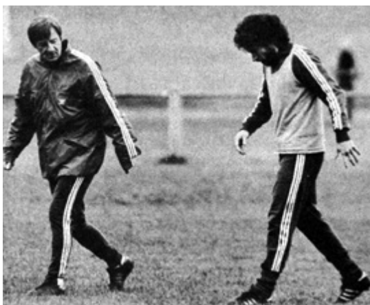
és egyik legnagyobb ellenségével, Paul Breitnerrel

Vagyis, bárhonnán nézzük is, mindenütt mély nyomot hagyott maga után: egyéniség, született stratégia volt, aki azonban ellentmondásos