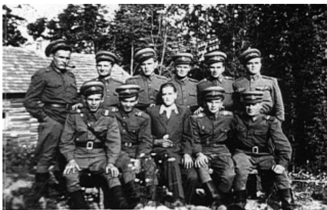
ÁVH-s őrszemélyzet, talán épp a kistarcsai táborban