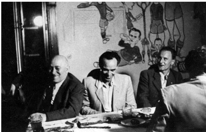
Két korszak, egylényegű rendszer – három pillér: Rákosi, Rajk és Kádár valahol egy zártkörű tanácskozáson, 1948 körül. A falon futballistákat ábrázoló karikatúra

Mert ismét Illyés halhatatlan sorait idézve: „(...) hol zsarnokság van, / mindenki szem a láncban; / belőled bűzlik, árad, / magad is zsarnokság vagy (...) / mert ahol zsarnokság van, / minden hiában, / a dal is, az ilyen hű / akármilyen mű, / mert ott áll eleve sírodnál, / ő mondja meg, ki voltál, / porod is neki szolgál.”