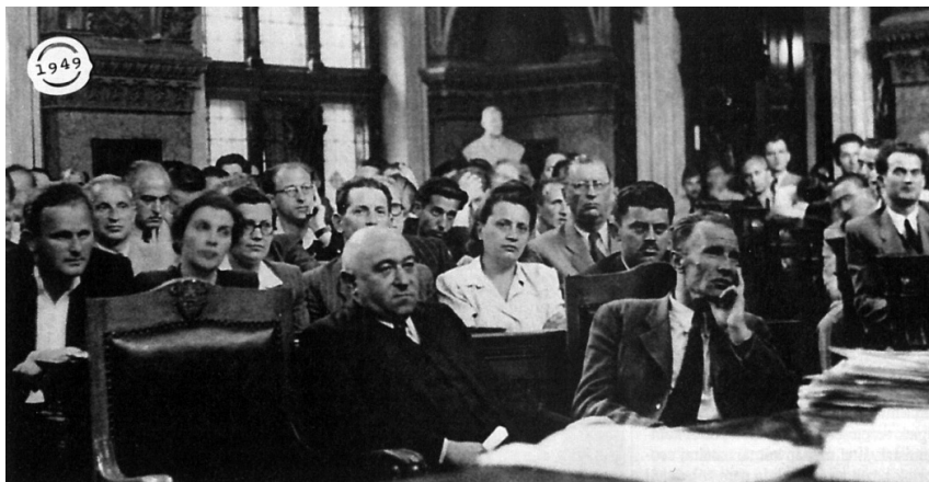
Az új hatalom 'kemény magja' 1949-ben. Előtérben Rákosi Mátyás és Kádár János (Kádár mögött Szirmai István)

S mivel a rendszer 1948 óta vegytiszta zsarnokság , ott bizony, Illyés Gyula klasszikus soraival – „mindenki szem a láncban”, ha tetszik neki,