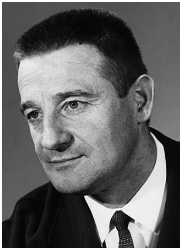
Nagyon kedves is tudott lenni

a maga számára. Mindenkor lelkiismeretes munkát végzett, de vérmérséklete gyakran elragadta. A következetesség volt a mércéje, és ugyanezzel a következetességgel csapott össze játékosokkal, vezetőikkel, ha terveit veszélyeztetve látta. [...] Akit bizalmába fogadott, az csakhamar tapasztalhatta ennek a kemény férfinak minden kedvességét, báját. Aki elszívott vele egy jó szivart, megivott vele egy pohár jó bort, elfogyasztott vele egy jó ebédet, megismerte benne a szellemes csevegőt, az soha nem feledheti el Lóránt Gyulát. 43