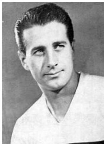
Bozsik József pályája csúcán, 1953 körül