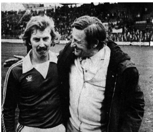
Legkedvesebb német futballistájával, Jürgen Grabowskival az Eintracht Frankfurtnál