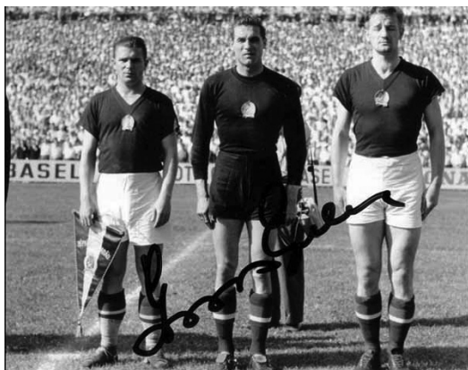
„Szoros, merev vigyázzban”: a kapitány (Puskás), a kapus (Grosics) és a középhátvéd (Lóránt) egy válogatott meccs előtt a magyar himnuszt hallgatják

Az ÁVH és – mint fentebb láttuk – maga Péter Gábor annál inkább. Ehhez a zsigeri ellenszenvhez nyilván hozzájárulhatott, hogy egy elszórt adat szerint Lóránt apja fia nagyváradi korszakában maga is a váradi pályaudvaron teljesített szolgálatot, ott is látták utoljára, így esetleg mint munkáját végző vasúti rendőrtisztnek neki is része lehetett a nagyváradi zsidóság deportálásában. Nyilván egyáltalán nem véletlen, hogy amikor kislánya születése évadján ismét feltámadnak vissza-