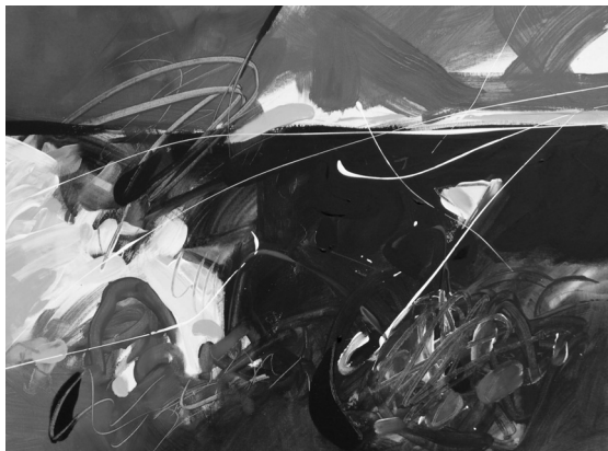
(akríl, vászon, 60 x 80 cm)

– Ennek a tudománynak kellett volna legyen legalább egy névtanos kutatója az intézetben. Mert akárhogy is nézzük, ha az irodalmat, mondjuk Arany János költészetét kutatja valaki, akkor száz év múlva is Arany János költészete lesz. De amit én ebben az atlaszban lefektettem, az száz év múlva már nincs meg. És az a helynév, amit én most felgyűjtök, az már nem Középlak lesz, hanem Allahakbar. Háromszék helyneveiből hiányzik 40 falu helynévanyaga. Hát hogy nincs egy fiatalember, aki azt megcsinálja? Ha én 40 éves lennék, akkor mennék, de most már nem mehetek. Márpedig az, hogy ott milyen helynevek vannak, az nagyon érdekes. Vagy a mezősegí román falvak tele vannak magyar helynevekkel. Románul mondják, de magyar nevek. És azért az fontos lenne, hogy megmaradjon.