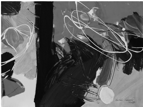
(akril, vászon, 50 x 70 cm)