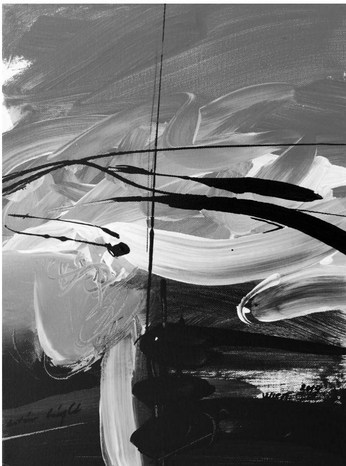
(akril, vászon, 40 x 30 cm)