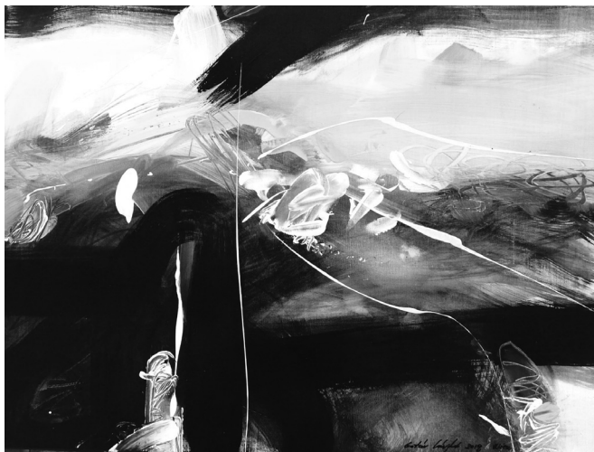
(akril, vászon, 60 x 80 cm)

Ez mind csak tréfa, látod te is, csak kicsit arrébb kell állnod, mert a vén hölgy, melynek neve Romlás, eltakarja.