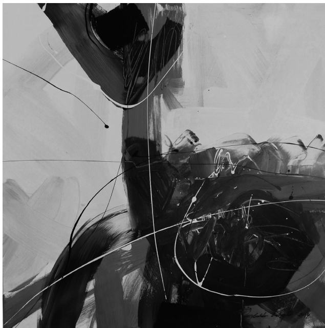
(akril, vászon, 80 x 80 cm)