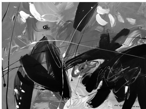
(akril, vászon, 60 x 80 cm)

Oravecz Imre szociografikusan részletes leírásokat készít a különbö- ző mezőgazdasági munkákról, ember és állat, ember és gép összhang- járól. Ha már Móriczot emlegettük: olykor mintha A boldog ember egy-egy mozzanata, figurája elevenedne meg (ha belegondolunk, a két világ nincs olyan messze egymástól, sem időben, sem térben). Szug- gesztíven ábrázolja, hogy a kommunizmus kivérezte a parasztságot, ezzel olyan változásokat indított el a társadalom mélyszerkezetében, amelyeket aztán nem tudott kontrollálni. Az egyén, habitusának megfelelően, ellenlépéseket tesz, megpróbál túlélni, kivárni, amíg a hatalom megbukik. És a könyv azt sugallja: nyeresre áll. Amíg van erő, van föld-, haza- és emberszeretet, addig nincs veszve semmi.