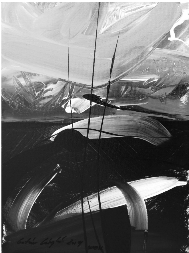
(akril, vászon, 40 x 30 cm)

tá való útvonalon: lépcsőházból ki, balra, zöldséges, útkereszteződés, virágbolt, újságos, kanyar, pékség. Az útszéli fákról porhót sodort arcomba a szél. Az újságosbódé ablakában eladó karácsonyfadíszek tornyosultak, kézzel festett gömbök, megálltam egy pillanatra szemügyre venni őket. Naponta csak egyszer adtak enni az alzheimereseknek, tévedt pillantásom egy szalagcímre.