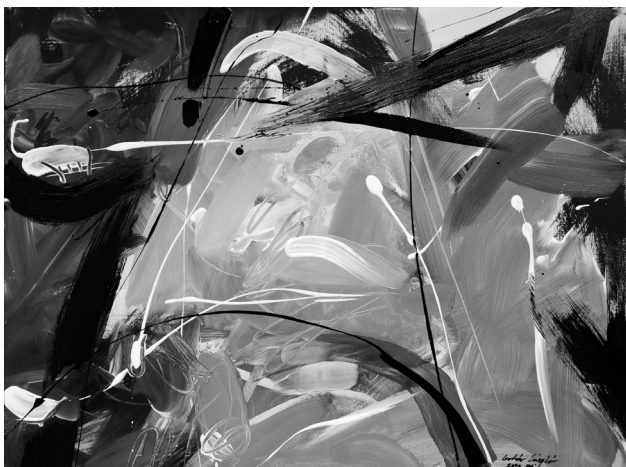
(akril, vászon, 60 x 80 cm)

„Eltűnt az ifjúság, / Mikor még hetyke, víg próféta, / Bevallottan is bujdosó, / Kocsmasztalnál agitált, ágált / Esmék, álmok után mászkált, / Tudta, mi a rossz s mi a jó! / Körötte társai kerengtek: »Felépül-e az új világ? / És ölhetnek-e emberarcot / (...) A sokat próbált ideák?«”; „Ősz van, Elhúztak már a darvak, / Fecskék, női telefonszámok. / Utánuk Poe hollója károg. / Ámor, hatalmas a hatalmad.”; „Érted? Nem érted? Ez az élet! / Ha már megérted, el nem éred! / Igazolódik minden tétel, / Amit látsz: pornófilmfelvétel.”; „Innék, ha nem kellene írnom. / Elhülyült, vándor, a világ!”; „A múltunk / utánunk nyúl. Gödörbe hullunk. / Mi egyszer megvolt, nem vesz el, / Undorít förtelmeivel!” (Molnár Vilmos)