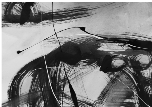
(akril, papír, 50 x 70 cm)

Kontra Ferenc regényfiguráinak nincs nemzeti hovatartozása, a városnak, amelynek hídjára a bombák hullanak, nincs országhoz tartozása, nincs neve. Nem tudjuk, milyen nyelven beszélnek lakói. Mindezt elhallgatja előlünk a történetmesélő, azzal a szándékkal, hogy figyelmeztesse befogadóit: vannak a történelemnek a benne ábrázolt figuráknál ezerszer fontosabb mozgatói – az ember és sorsa elől eltitkolt törvények, amelyek egy látható és felfogható előzmény előtti pillanatban működésbe lépnek, és attól kezdve ezek a kérlelhetetlen törvények lépnek a sors szerepébe. Ezzel eltörlődnek az olyan jelentéktelenségek, mint a jellem, a becsület, a szeretet és más haszontalanságok. A történelmet díszletnek használó gonoszt ugyan időlegesen vissza lehet szorítani barlangjába, de elpusztítani sohasem.