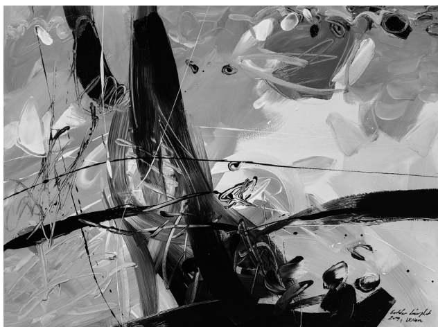
(akril, vászon, 60 x 80 cm)

Pannoni gardénia, te csak nyújtsad az ágad, zord havak fénye nehogy ijesszen, hol tetű rág, s nyomorító kaloda szorongat, illatozz csak, ha nincs is még tavasz.