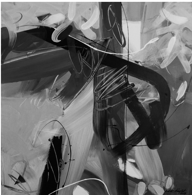
(akril, vászon, 80 x 80 cm)

a fára egy zsidó gyógyítót. Harminckettő és harminchárom között ébren vagyok, mert a gyerek nem alszik el. A ringatással újra álmodni kezd. Én viszont nem fekszem vissza most már: teleeresztem a kádat egy kihalt tenger vizével, lebegni készül benne, ami él: megszületni fog.