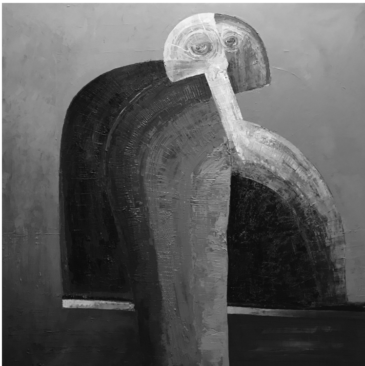
Veress szárnyú angyal

SZ. OKL. ÚJ = Székely Oklevéltár. Új sorozat.