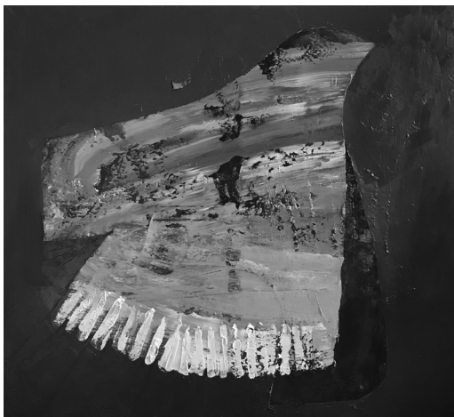
Lelkem kicsi madara