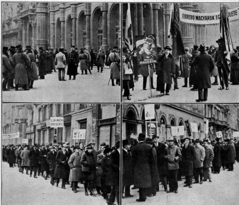
A magyar főváros nagyerőnyű tüntetése a trianoni igazságtalan béke ratifikálása ellen. Képeink: 1. A Vigadó-tér környéke, mielőtt odabent a tiltakozó gyűlés folyt. — 2. Az „Ébredő Magyarok Egyesülete” megnyitja a tüntető menetet. — 3. Részlet a menetről. — 4. A „Területvédő Liga” csoportja az ország gazdasági erőforrásait föltüntető táblákkal.

Tüntetés Budapesten a békeszerződés ratifikálása ellen