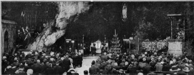
Mise a lourdesi csodaterő Szűz-Mária barlangjában. A kép felső részében közepén van az a hely (a szobor helyén), ahol a Boldogságos Szűz megjelent Soubirous Bernadettnek 1838 febr. 11-ikén. A barlang falait a meggyógyult bédák telccaggatták mankóikkal.