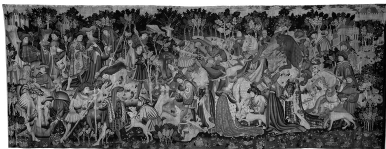
Angol falikárpit a medve hasonló ledőfésével (1425–1430)

A székelyszentléleki falképen látható, medvével való küzdelemre egy magyar és több korabeli nyugati párhuzamot azonosítottam. Bár azt gondoljuk, hogy krónikáinkat, illetve azok képi világát jól ismerjük, keveseknek juthat eszébe a Képes Krónika azon miniatúrája, mely a mitikus Nimród alakjához kapcsolódik. Felbecsülhetetlen értékű forrásunk a rejtélyes nagy királyt történetesen éppen egy medvevadászaton ábrázolja. 48 A miniatúrán három kisebb csoportban nyolc férfialak látható, amint kutyákkal megerősítve hajtják, üzik a vadat a hegyek között, és két kisebb medve harcol az életéért. Bár a Képes Krónika ábrázolásán gyalogosan és csoportosan küzdenek a medvével, mégis