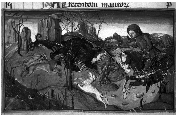
Német hóraskönyv jelenete a medvevadászattal (15. század)

őrzött, 15. század második feléből való német Hóraskönyv miniatúrája, melyben az október hónapot a medvevadászat jelképezi. 53 Mivel Szent Gál ünnepe október 16. napja, nem véletlen, hogy ez a fajta szimbolika jelenik meg. A középkori Európa klasszikusa, a Gawain és a Zöld Lovag legendájában ismeretes vadászcenék szintén segít a téma megértéséhez. Miközben Gawain lovag a rejtélyes várúrnál (valójában a Zöld Lovagnál) vendégeskedik, addig annak felesége a vadászat ideje alatt, három napon keresztül próbálja őt elcsábítani. 54 A próbát végül kiállja, s elnyeri a zöld színű selyemövet, mely viselőjének sebezhetetlenséget ad. Az őv az alsó erők feletti uralmat jelképezi és a sikeres küldetés után a kerekasztal lovagjainak viseletévé vált. A medve királyszenttel való ábrázolása ily módon az alsó erők, a vágyak, a harag legyőzését szimbolizálhatja a szentléleki falképen.