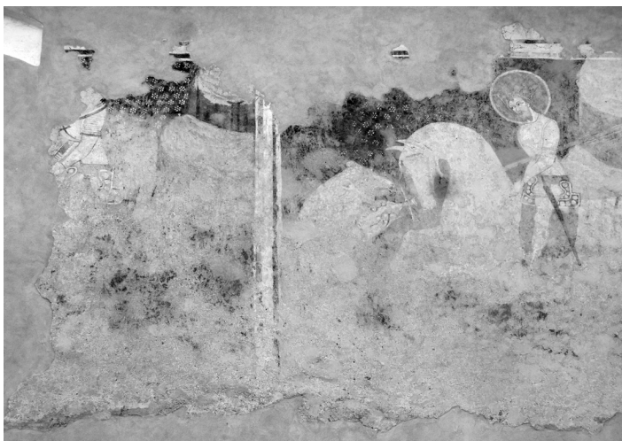
Az ún. miles christianus ábrázolás, Székelyszentlélek, 1420 körül

világa megegyezik a Csikmenaságban fennmaradt Szent László-legenda falképen lévőekkel. A fehér minta közepén kör, körülötte hat darab rombuszforma, amik együttesen mintha csillagos égbolt képét mutatják. Ezek alapján, illetve a viseletek, páncélzatok, egyéb történelmi kapcsolódások figyelembevételével a székelyszentléleki falképet 1419–1430 közé datálhatjuk.