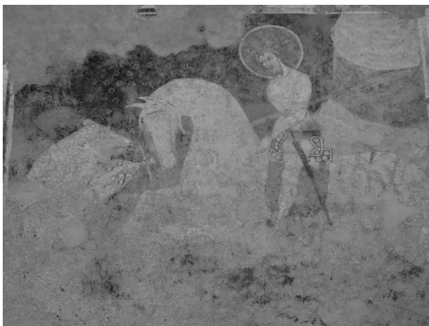
Szent László küzdelme a medvével. A medve az alsó erők (kéjvágó, harag) megtestesítői a középkorban.

gyarázatot a lényre. Véleményem szerint azonban a lószerszámok, a hadi viseletek részletekbe menő, aprólékos kidolgozottsága, a ló légius kecsességének megjelenítése, s maga a medvealak kizárja a tévedést. Ráadásul számtalan tipikus sárkányölő Szent György- (Gyulakuta, Segesvár, Almakerék) vagy sárkányábrázolást (Székelyderzs, Bögöz, Székelykeresztúr) ismerünk a Székelyföldön, vagy a közeli száz helységekben. A derzsi műhely festői egyébként is gyönyörűen kidolgozott sárkányt festettek Székelyderzsben. A Szent Mihály alakja alatt látható, tekerdő sárkánykígyóra rátapos és lándzsával átdöfi a fogakkal teli pofáját. 35 A Sátánt jelképező szörnyeteg jól felismerhető. A medvevadászat azonban valóban szokatlan ikonográfiai ábrázolásmód és pontosabb magyarázatra szorul. A medve mint címertani jelkép ismeretes a székely címerben, melynek legkorábbi ábrázolásai a bögözi templom szentélyében található faragott gyámkövön 36 (15. század) és a székelydályai templom festettszentély-boltozatán (1505–1525) látható. 37 Ez utóbbin a címerpajzs vörös alapszínnel ellátott címerképe egy felhőből kinyúló páncélos kar, amely egy kétélű kardot markol.