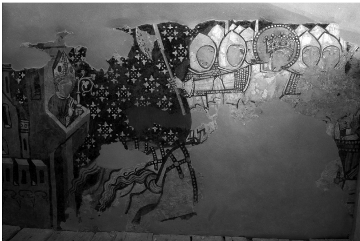
Jól láthatóak a derzsi párhuzamok, a páncélok formája, peremezése.

jelenetében a király a csípőjére eresztve visel egy széles, nagy körökből álló veretes övet. 27 Még közelebbi párhuzamot vélek felfedezni a derzsi műhely által festett páncélok és fegyverövek stílusjegyeit illetően. A Zsigmond-kori csontnyerges (Batthyány-nyereg, Jankovich-nyereg) sárkányölő Szent Györgyöt ábrázoló faragványain peremezett, erősen karcsúsított mellvérték láthatóak karvérték nélkül. Mindegyik műalkotáson a csataszoknyákon látható fegyverövek csípőre vannak eresztve, s arányosan ugyanolyan szélesek. 28 A felső, egyben vékonyabb részük téglalapokra oszlanak, vagy fonottan tagoltak, az öv alsó, szélesebb része pedig négyzetformákból áll, mint a székelyderzsi Szent László, Szent Mihály arkangyal és a szentléleki falkép lovasainak az öve. A négyzetformákat középen egy veret ékesíti. Székelyszentléleken a bal oldali lovagalak övén még fellelhetők az apró, fehérén pettyezett díszek, melyek mintázata a székelyderzsi Szent Mihály és Szent László fegyverövén ábrázoltakkal azonosak.