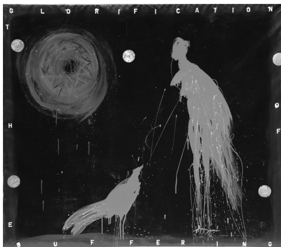
A dicsőtés szenvedése, 2001