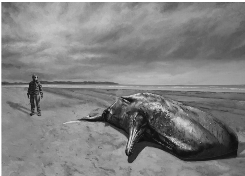
Jónás és a cet, 2017 (olaj, vászon, 50 x 70 cm)