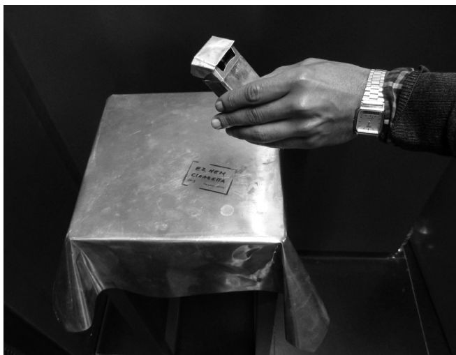
Hommage à René Magritte, 2019 (sárgaréz lemez, riasztókészülék)

Dugovics Titusz lerántotta a törököt a mélybe. Szócs lerántotta Dugovics Tituszt a mélység magasságából egy glossza mélységébe, egy glosszányi ürességbe.” 28