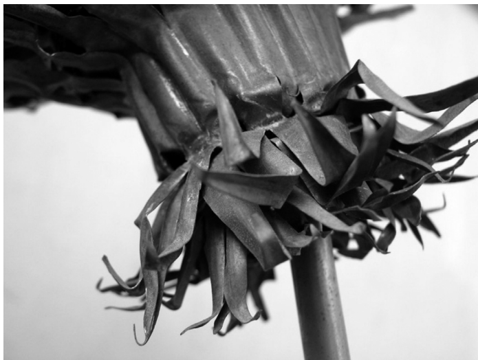
Pitytang, 2007, részlet (vörös- és sárgaréz lemez)

hogy a székelyeket a 12. században már nem lehet sztyeppe-i hadviseléssel szerepeltetni, az ispánok a korszak hadakozási ismereteivel irányítottak, vezéltek, akár külföldi származással, hagyománnyal is rendelkezhettek. Másfelől, a székelyek a magyar királyság szerves részét képezték. Egy részük a várispánságokban, külön századoskerületbe voltak szervezve. 30 Ezek hadakozás során az ispánsági sereg részeként harcoltak. A fenti csaták alapján viszont külön ispánságba, esetleg ispánságokba szervezett székelyekkel is kell számolnunk, hisz külön adtak egy jelentős seregtestet. 31 A két csata során Janus nádorispán és Belus bán szerencsésen irányította a székelyeket, jól ismerve ezek erősségét, felszereltségét. A krónikás megjegyzése, mely szerint a székelyek szokás szerint a magyar csapatok előtt jártak, csak azt igazolja, hogy rendszeresen alkalmazták őket a csaták során, a magyar seregek részei voltak a 12. században.