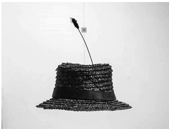
Kalapdimenzió, 2011 (sárga- és vörösréz lemez)

Eszek egy kis fagyit. Van itt ilyen nyeles a hűtőbe. Milyen jó finom az. Még a múltkor hozták a fiamék. Meg almalét is, meg baracklét, meg mit tudjam én, mit. Vízet. Minden van most egyelőre. Aszondta múltkor, látott valami darazsat a falba, óvatosan tapogatólódjak, ha kimenek. Majd megnézi biztos, ha itt lesz. A darázs nem jó, azok ne gyűjjenek.