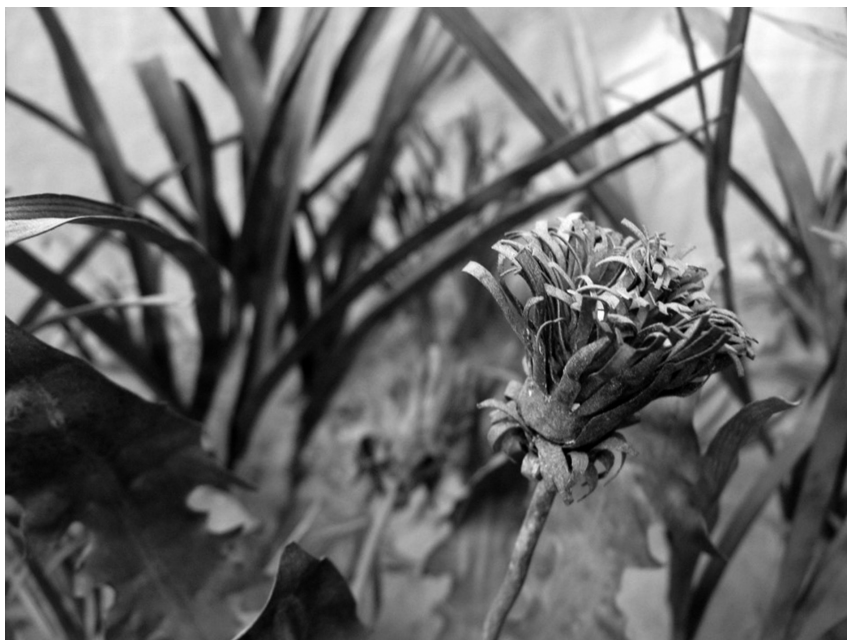
Meződimenzió, 2017, installáció, részlet (sárgaréz lemez, üveg, tükörfólia, világítótest)

Behunyom a szemem. Ott áll előttem a medve. Két páfránylevél közül mereven figyel. Gyönyörű feje, apró fülei jól kivehetőek. Pár pillanat múlva orrát felemelve szimatol, majd rohanni kezd. Nyomában sötétté válik az avar.