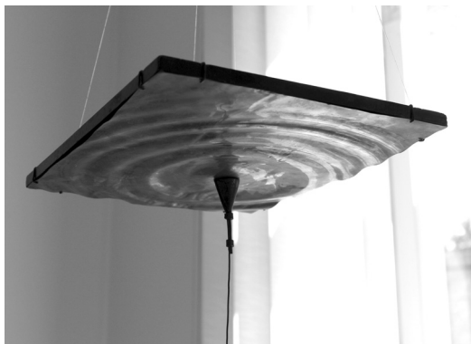
Csali, 2009 (vörösréz lemez)

A mindig boldog mindig-életem Ha nem halok meg hogy temetik el S ha nem halok meg boldog hogy leszek Ha boldog leszek nem halhatok meg