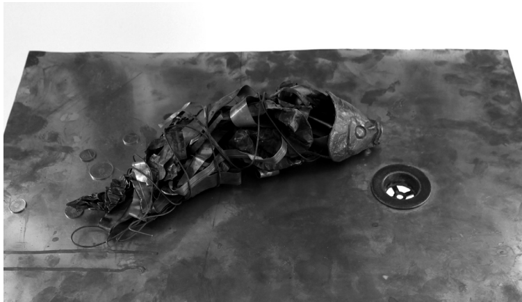
Aszály, 2017 (vörösréz)