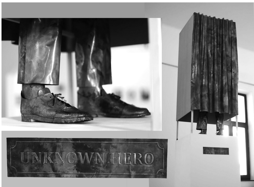
Ismeretlen hős, 2020 (rézlemez)

Néhány éve kétlaki életet élünk, New Yorkban és Budapesten, remélem, a járvány elmúltával többet jöhetünk majd haza. Még mindig bizakodom abban, hogy megtalálják édesapám földi maradványait, és megadhatom neki a végtisztességet.