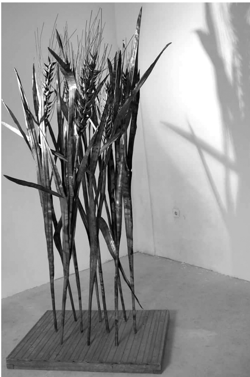
Füerdő, 2009 (sárgaréz lemez)