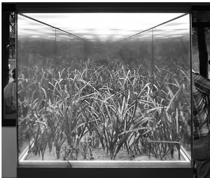
Mező, 2017, installáció (sárgaréz lemez, üveg, tükkörfólia, világítótest)

arrébb a várfalra valaki régebb erre járó felvéste tört-én-elmének biztos tudatában jóval a jövő vízszint fölé minden erre sodródó nemzedéknek örök tanulságul a bűvös szót ERDÉJ