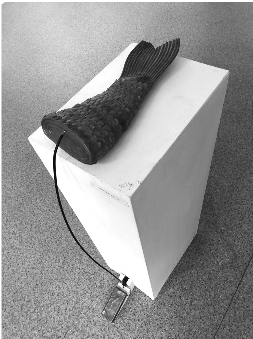
Fél hal, 2019 (interaktív kinetikus rézsobor)