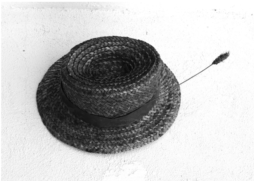
Kalapdimenzió, 2011 (sárga- és vörösréz lemez)

De mondhatom ennek az Ilkának, rám se bólint, úgy jár a szeme, mint a menyétnek. Mondja is, magának telik narancsra, magának van pénze! Mer’ azt a gyümölcsös tálat vette szemügyre. Hogy ennek a kislyánnak nem ad egy narancsot? Persze, ti azt gondoljátok, csak úgy pottyán az égből minden. Nem baj, vigyed, nesze, vidd az egész tálat. Mindig is mondtam, nincs ebben a faluban egy rendes ember, nagyítóval kell keresni, akkor se találsz. Hol kapsz ma már rendes embert?