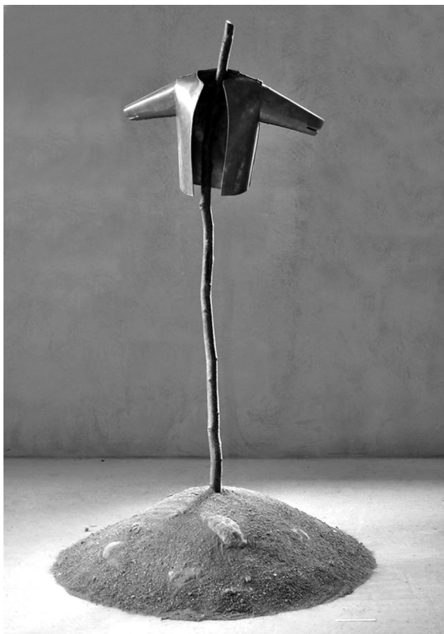
Réz madárijesztő, 2014 (vörösréz, fa, homok)

magyar nyelvű olvasó számára is könnyedén elérhetővé válnak. Mindenképpen érdekes élmény, fontos és szükséges tapasztalat lehet egy ilyen perspektíva megismerése, illetve a Stanca-féle történetláncolat és narráció befogadói átélése mindazok számára, akik a Robbanás olvasására szánják magukat.