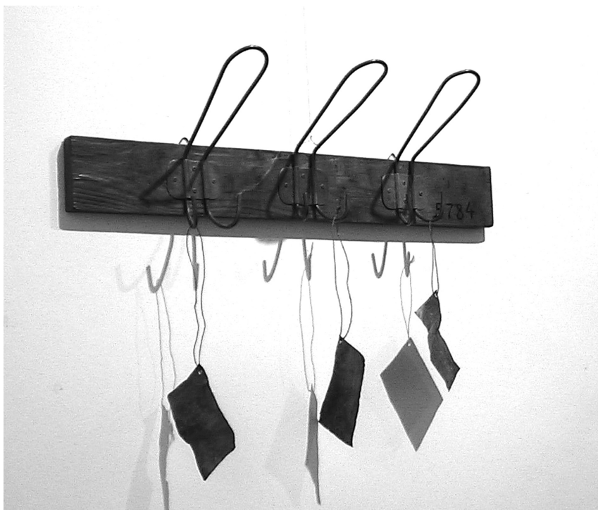
Foglalt, 2018 (vörösréz, fa)

A temetéskor szétvált a költészet és a teológia szövege. Mégis 1957. október 8-án három szöveg talált egymásra, és felelt egymásnak: Szabó Lőrinc sorsának-fájdalmainak jajdulásai, a klasszikus költő billegően összeszótt szövegei, és reménykedése egy tudós teológus Igét hirdető szavával. Egymáshoz kötődtek a „tragic joy” elégikusságában. A kortárs európai költészet meghatározó hangjának meghallásában.