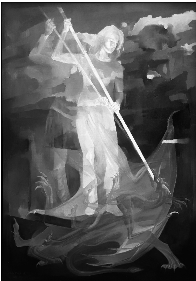
Apokalypsis – Mihály legyőzi a sárkányt, 2019 (100 x 70 cm, olaj, vászon)

hányaduk vált költővé, sikerült nemzedéki csoportosulásként is (és természetesen egyénileg is) jelentőset alkotni. Ennek minden esélye adott a Címtelen föld gárdája, kemény magja esetében is. Hogy ki alkotja a kemény magot? Az majd a gyümölcs elfogyasztása után derül ki!