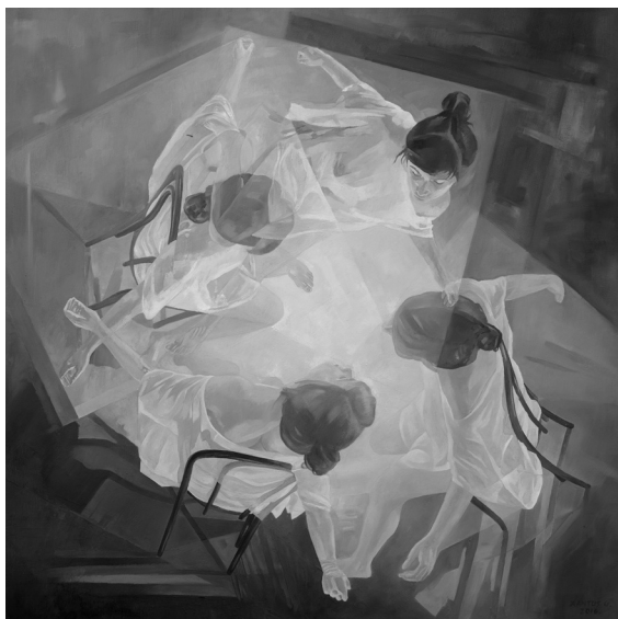
Körforgás, 2016 (100 x 100 cm, olaj, vászon)

Végző soron mindkét kötet esetében bizonyos jegyek erősnek, a mondanivaló jellegzetesnek mutatkozik, ugyanakkor más jellemzők (formai vagy tartalmi szempontból) gyengébbnek, kidolgozatlanabbnak tünnek. A költők pályakezdő mivolta megmutatkozik a szövegek együttesén, de nem rossz értelemben. Témáik, stílusuk egyedi a maga nemében, alkotásmódjuk pedig kellően izgalmas. Verseiket sokadszorra is olvasva úgy gondolom, hogy termékeny tapogatózásuk a további figyelemreméltó alkotások ígérétét hordozza.