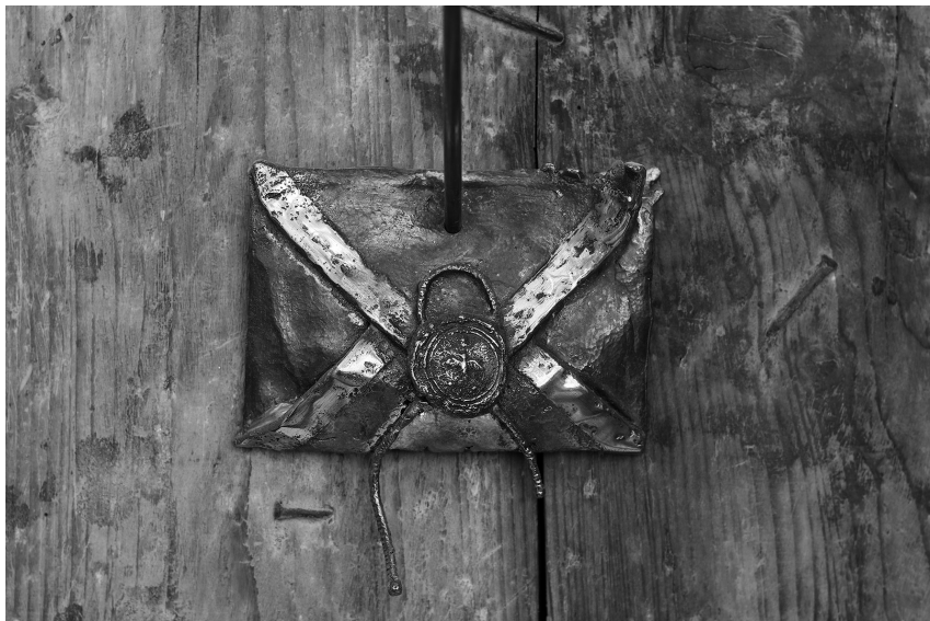
Üzenet, 2019 (részlet) (réz, bronz, fa)