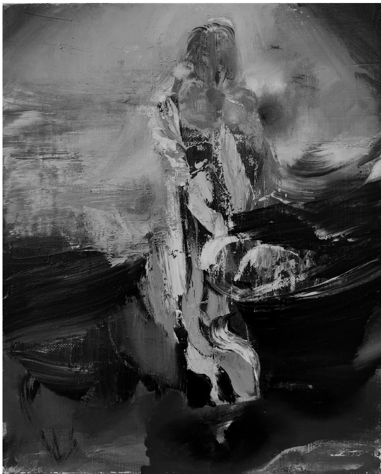
Fények emlékműve, 2021 (49 x 38,5 cm, olaj, vászon)

Lányokban megjelent szépirodalmi alkotásokat és ismeretterjesztő írásokat, akkor minden bizonnyal olvasták A szerkesztő postáját is, ahol néha egy-egy rövid válaszbba burkolva olyasmiről is tudomást szerezhettek, amiről egyébként máshol, a családban és iskolában többnyire hallgattak.