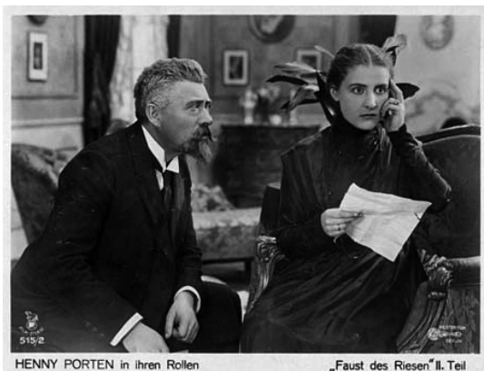
Jelenet Az óriás ökle című filmből.

Részben szintén a szenvedélybetegség okozta problémákkal és az azokból adódó lehetetlen helyzetekkel foglalkozik a Janovics-féle magyar filmgyár Akik életet cseréltek című alkotása, melyet 1919. május 18-án láthattak a csíkszeredaiak. 11 A korabeli mozi hírek alapján megállapíthatjuk azonban, hogy ebben az időszakban a drámák mellett