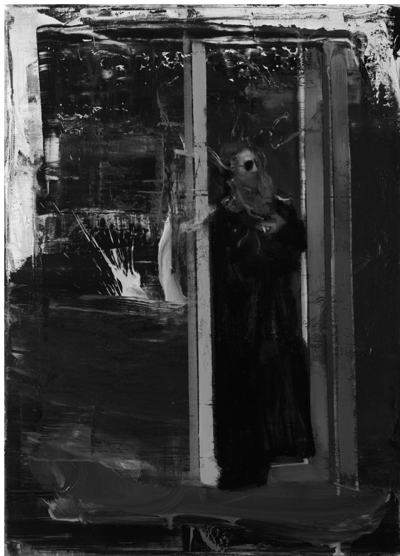
Solaris, 2021 (55 x 39,5 cm, olaj, vászon)

az újraalkotható – mindenségben. Újabb és újabb kötetekben. (Mint amilyen a költő 2021-ben megjelent A haza milyen? című könyve [Budapest, 2021, Kalligram Kiadó], amelyben a metafizikai dimenziót teremtő-vallató versnyelv helyett a közéletiség, a hazafiasság regisztere erősödik fel.) Hiszen a nyelv, a költészet mint az én földi mása teszi romolhatatlanná, eternitássá azt, ami mulandó. Érthető tehát az írástudó vívódása és felelősségtudata, mások részéről pedig az elvárás vele szemben, az ő felelősségét illetően: hogy végül – amint a Szótár című vers is utal rá – egy metaforában lakjunk mindannyian.