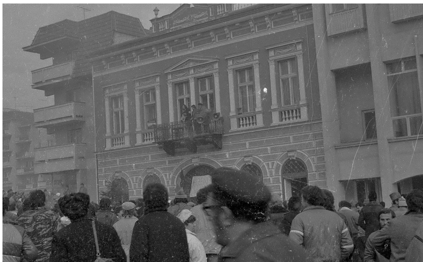
A sepsiszentgyörgyi pártszékház és környéke, 1989. december 22-én.

1989 decemberében írtam: „Zúgnak a fegyverek. Szaporítják mártírjaink. Érzem a keserű-szomorú szájízt, amint kibuknak, tolulnak, elővajúdnak lejáratott szavaink, amelyeket nem szabad magukra hagynunk, mert mi szintén fedezet, oltalom, értelem nélkül maradnánk. És íme: cselekszünk.”