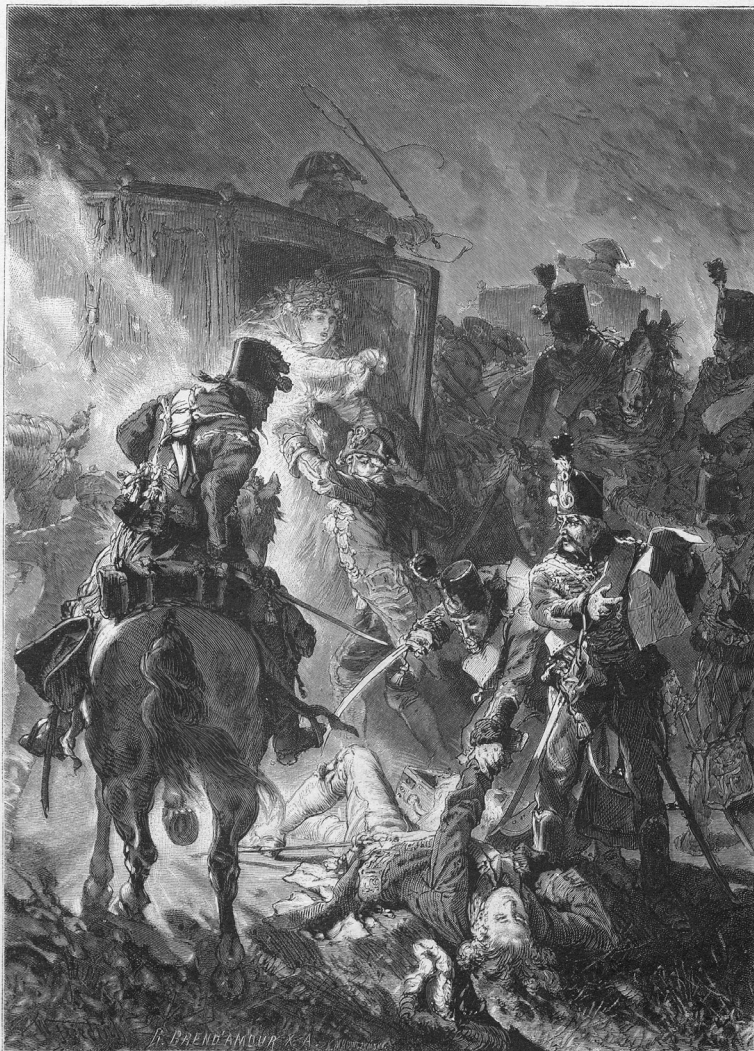
Der Rastatter Gesandtenmord. Originalzeichnung von W. Friedrich. (S. 19.)