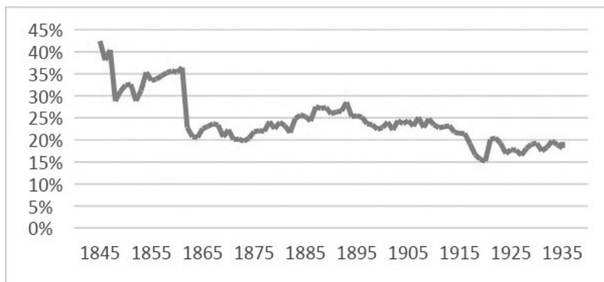
3. ábra. Előzetes eredmények, amelyek azt mutatják, hogy egy évben hány gyászjelentés felel meg a Lengyel Életrajzi Szótár körében szereplő személyeknek (azok a személyek, akik később helyet kaptak a szótárban, valamint közelebbi családtagjaik).