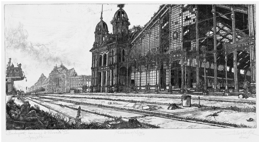
Nyugati pályaudvar, 2006 (repszés, rézkarc, aquatinta)