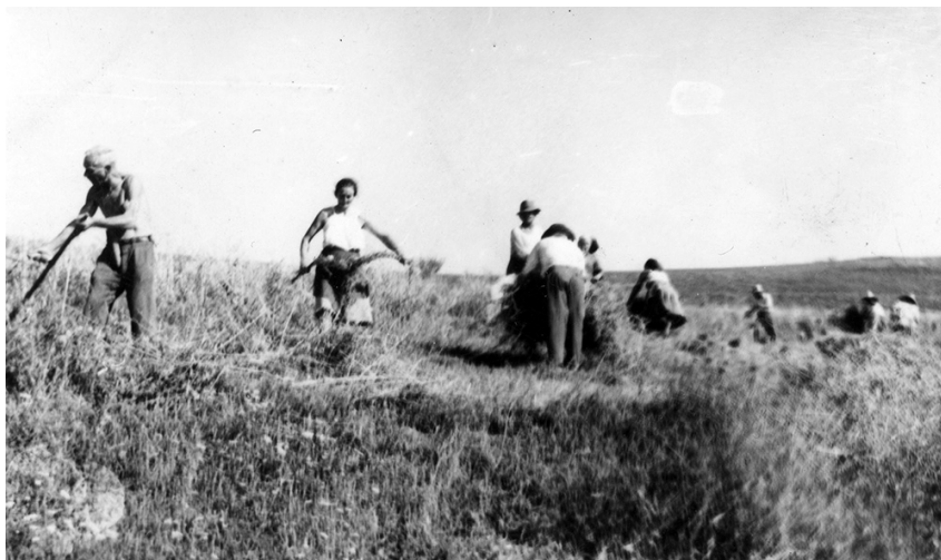
Aratás a homoródalmási kollektív gazdaságban, 1965

F. Károly: Vezetőtanács ismerje el, hogy nehéz körülmények között dolgozik a tagság a mezőn. Kéri, hogy a vetett takarmányok kaszálását ehhez mérten adja ki a tagoknak százalékra. Nem helyes 20%-ra kiadni a takarmányokat. Több százalékot javasol, amely által a tagoknak nagyobb munkakedvük lesz, és a fogatosoknak is érdekük, hogy a takarmányok időben raktárakba kerüljenek. Nem helyesli, hogy a Vezetőtanács nem