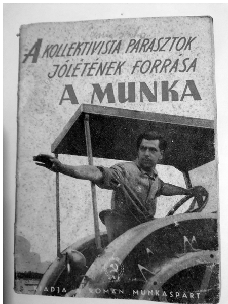
A kollektívtagokat munkára ösztönző brosúra

1967 januárjában a termelőszövetkezet brigádgyűlésén a vezetőség az új munkanorma tervezetet ismertette. A termelőszövetkezeti tagok elégedetlenek voltak „a központi Unió”-tól kapott normatervezettel: sokallták a normázott munkaegységért meghatározott teljesítményeket a különböző munkaféleségeknél, kifogásolták, hogy a munkateljesítést nehezítő helyi környezeti adottságokat (pl. a művelt területek távolsága a lakóhelytől) nem vették figyelembe a munkanormák megállapításánál.