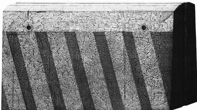
Kamil Kocurek: Barrier 2a , 2020 (70 x 100 cm, rézkarc, foltmaratás)

A hátlapon olvashatjuk: „Czilli Aranka költészete fájdalomból és örömből szőtt pillanatmintás égtakaró.” Ebben a kötetében is megragad költői megszólalásmódjának ereje, közvetlensége, hitelessége, témáinak sokrétűsége, képeinek befelé táguló világa, egy-egy markáns képbe tömörülő gondolatának további felismerésekhez vezető árama. A kötet megírása idején a szerző Térey János-ösztöndíjban részesült.