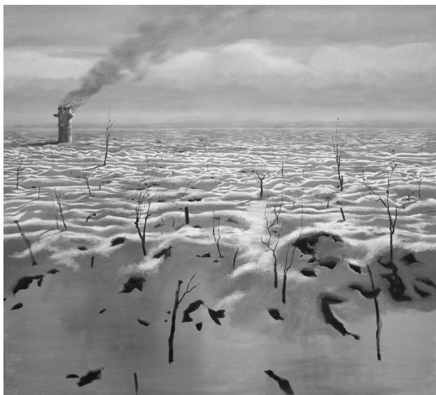
Tűz, 2022 (olaj, vászon, 180 x 200 cm)

A mohácsi csatát megörökítő miniatúra az 1558-as Szülejmánnáméból származik 43 , a kiragadott rész akindzsi vezért ábrázol, harci csákány használata közben. A miniatúrák a szultánt, környezetét és a vezéreket szerepeltetik, hagyományos ábrázolási stílus alkalmazásával, de korabeli fegyverek bemutatásával.