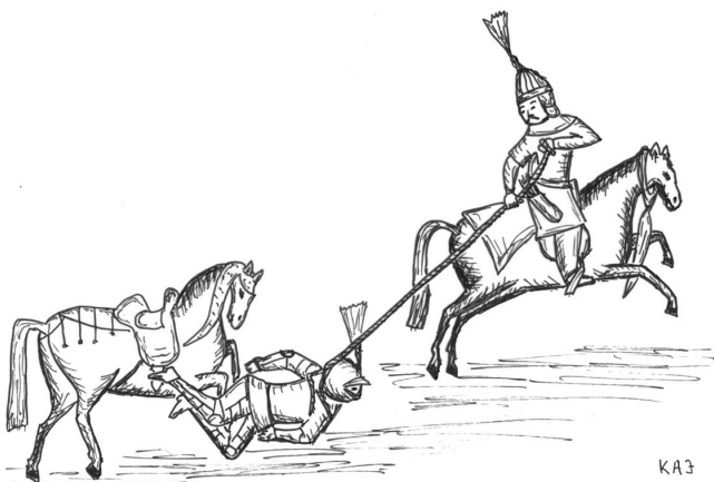
Akindzsi kötéllel harcol páncélos katona ellen (török miniatúra alapján rajzolta Kolumbán-Antal József)

voltak felszerelve. A német beszámolóból tudjuk, hogy ágyukat is vittek magukkal a törökök, ezek azonban csak kisebb lőszerszámok lehettek. A havasalföldi vajda is elkísérte a törököket. Az ő esetében német forrásunk csak gyalogos katonákról tudósít, de valószínű, hogy a vajdát – rangjához illően – lovasok is kísérték.