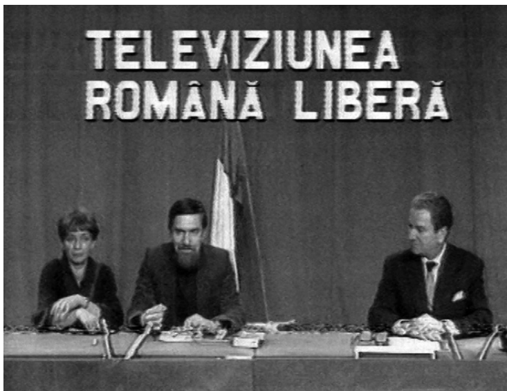
Az első jelentkezésünk