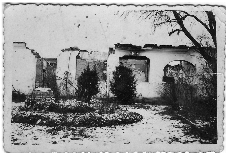
A gyantai parókia 1944 decemberében