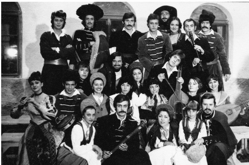
A Mondod-e még forgatásán

- Semmi. Mindez természetes egy normális világban, de a '70-80-as évek Romániáját egy paranoiás, önimádó diktátor házaspár és klientúrája birtokolta, a rendet és a fegyelmet a gondolatrendőrség, a titkoszolgálat ellenőrizte. Körülöttünk meg volt húzva egy krétakör, amiből kilépni nem lehetett, de örültünk, ha néha-néha, legalább a fél lábunkkal mégis megérintettük a körön kívüli talajt. Ilyenkor azt hittük, hogy