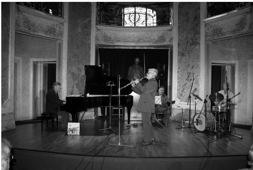
Jazzest a bukaresti Cantacuzino-palotában 2010-ben

– Magamat legfeljebb média-mindenesnek tartom, és egy kicsit zenésznek. A kettő kiegészíti egymást: média-mindenesként mindig valamiért igyekeztem dolgozni, egy eszméért (a köz, a magyar közösség szolgálata), egy elvért (szabad szólás, magyarul), zenei szerkesztőként, menedzserként a fiatal tehetségekért. Jazzmuzsikusként, zeneszerzőként pedig én csak én voltam, magamat adtam, vagy kerestem .