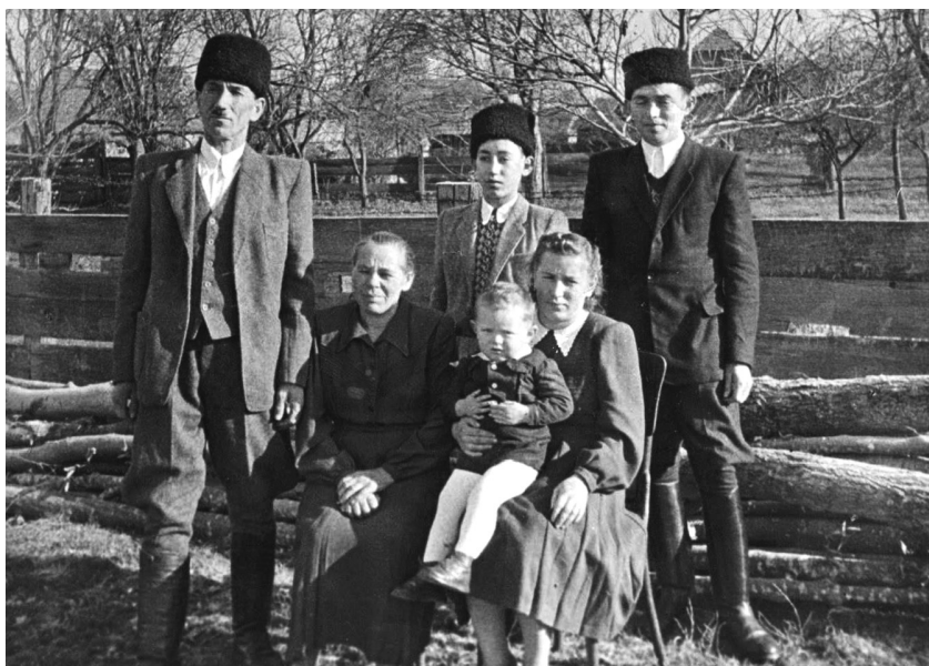
Anyai nagyszüeim, fiuk, valamint szüeim 1955 novemberében

Bujdokolva ért haza aggódó kis családjához – lánya kilencéves volt ekkor, felesége a második gyermekkel terhes –, helybeli mentorai pedig azt tanácsolták, hogy ne is nagyon mutakozzon, a helyi román hatóságoknál ne jelentkezzen, mert egy-két héten belül nagyot fordul a történelem kereke. Aztán Kisboldogasszony napjára megszületett a fia, s néhány nap múlva bevonult a magyar hadsereg Kézdiszentlélekre. Szerencsés hazaérkezése tehát, azaz Nagyboldogasszony napja így lett az ő személyes lelki ünnepe is, amiről minden évben megemlékezett. Az 1996-ost már halálos ágyán érte meg, másnap virradóra hunyt el.