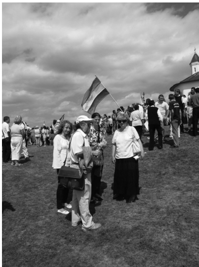
Az augusztus 20-i Szent István-napi búcsú Perkón, 2009-ben

- Írtam én azért kimondottan bíráló jellegű kritikákat, csípős irodalmi jegyzeteket is! Egyik-másik vitát provokált a sajtóban, más esetben meg szóbeli ejnye-bejnyezésre, sőt megintésre is sort kerítettek az érintettek és „szövetségeseik”, szóval nem volt visszhang nélküli kritikai véleményalkotásom.