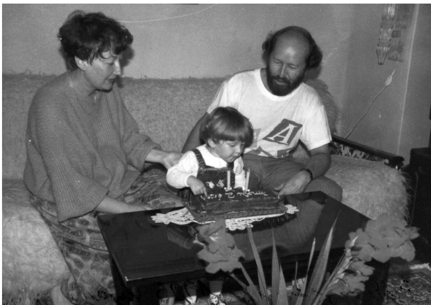
Imola kislányunkkal két éves születésnapján, 1992. szeptember 5-én

Ha megérzed magadban az elhivatottságot, akkor hallgass erre a belső hangra, és tegyed a dolgod kitartóan és alázattal – s igenis: nagy felelősséggel! –, amíg az égi hatalmak engedik. Példatáram elég gazdag, van hát akire figyelmem, van akit követnem ilyen téren.