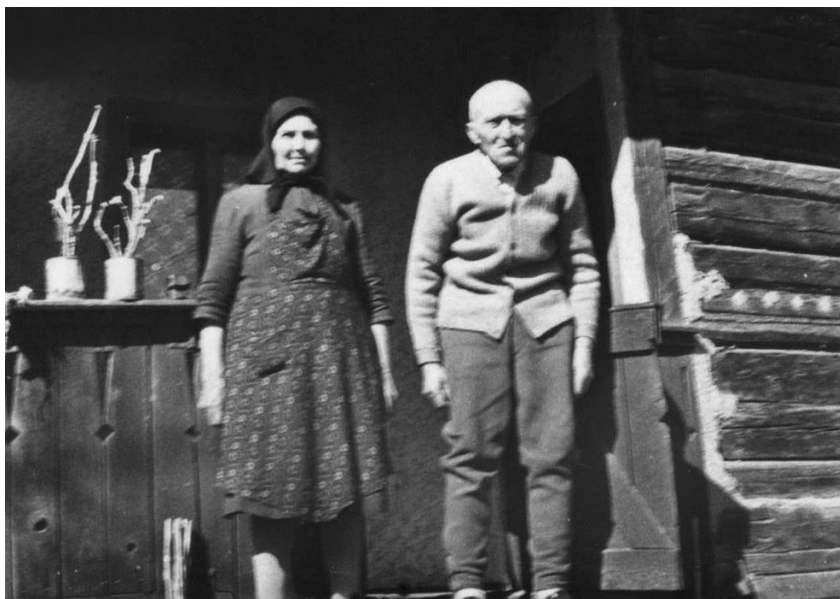
Apai nagyszüleim az élet alkonyán

Anyai nagyapám a hat testvér közül ötödiknek született, így kilencévesen csak bámulta a szentléleki poros utca széléről a gyalogosan, mezítláb vagy bocskorosan vonuló román megszálló katonákat 1916-ban, de aztán amikor odatelt az idő, volt ő maga is banghinának csúfolt