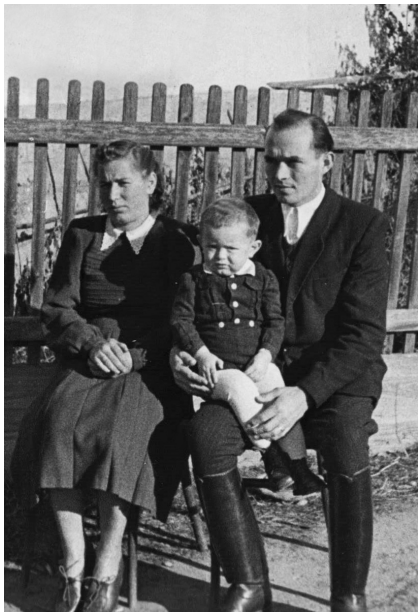
Szüleimmel 1955 novemberében

A bölcsészkar könyvtárában, a periodikák részlegén szabad polcról magyarországi szépirodalmi folyóiratokhoz lehetett jutni, a hazaiak mellett, amelyeknek különben már középiskolás koromban olvasója, sőt egyik-másiknak előfizetője voltam. Az irodalmi élet egyes szereplőivel különben már a középiskolában ismerkedhettünk. Kányádi Sándorral éppenséggel tizenegyedik diákként találkoztam líceumunk dísztermé-