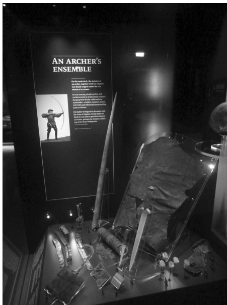
A Mary Rose elsüllyedésekor az egyik ágyú alá szorult íjász felszerelése a portsmouthi haditengerészeti múzeumban

erősségű íjakat használtak, amelyekkel akár 300 m távolságra is lehetett lövést leadni. 27 A középkori botjak és reflexíjak hasonló teljesítményre voltak képesek. 28