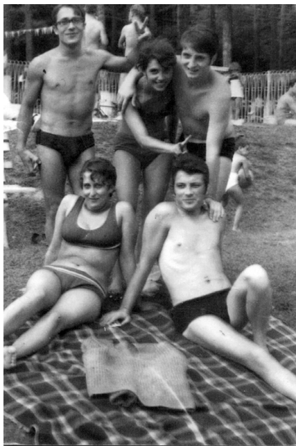
Vidám percek a maroshévízi Bánffy-strandon