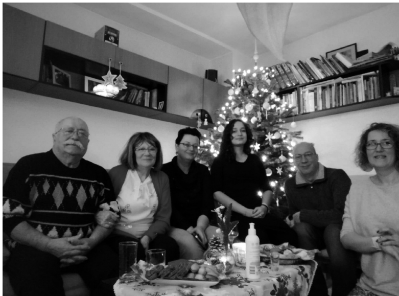
Családom 2023 karácsonyán