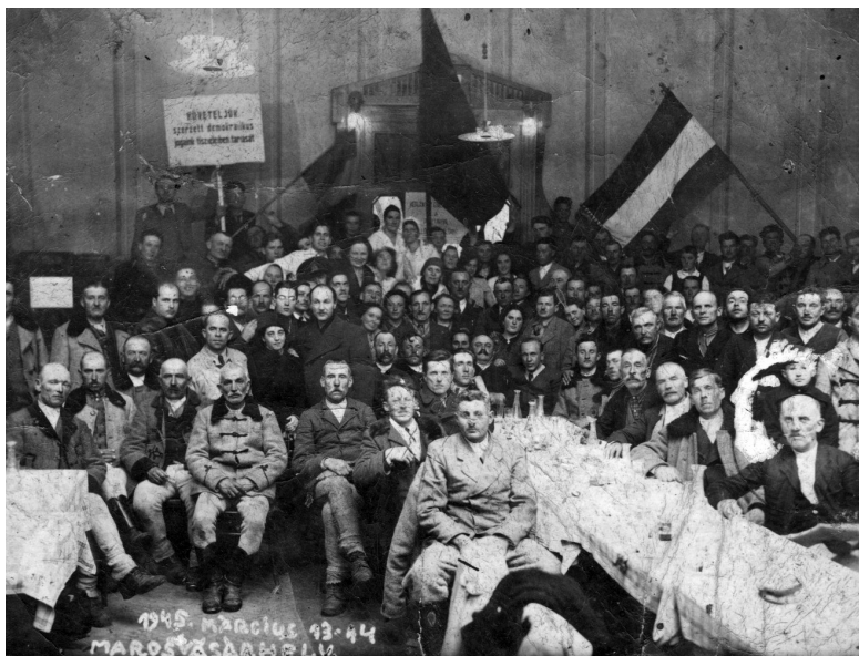
MADOSZ-gyűlés Marosvásárhelyen, 1945. március 14-én.

feliratokat sem szedték le. 14 Az új helyzet másik folyománya az volt, hogy a közrend fenntartása érdekében ún. népőrséget hoztak létre (erre valószínűleg mind a 11 megszállt vármegyében sor került, de csak Kolozs, Beszterce, Csík, Udvarhely, Háromszék, Maros-Torda vármegyéből vannak erre vonatkozó adataink). Városokon ez főleg politikai szempontból megbízhatónak minősített egyénekből verbuválódott, a vidék megszervezését pedig kezdetben a városokból kiküldött szakszervezeti aktivisták vállalták magukra. Az újonnan toborzott népőrök felszerelése a visszavonuló német és magyar katonai egységektől maradt, az egyenruhát – legtöbb esetben – csak egy vörös karszalag helyettesítette.