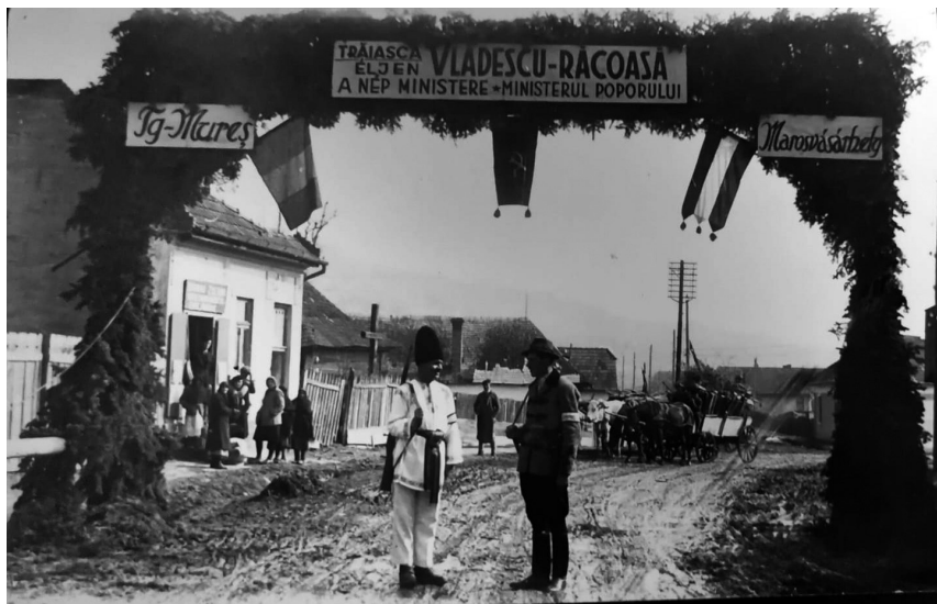
Román és magyar népőr Marosvásárhelyen, 1945. március 15-én (László Csaba gyűjteményéből)

ban jártak, az 1945 áprilisában már féléves maros-tordai népörségnek még nem volt egyenruhája. Ez valamelyest arra is kihatott, ahogyan az emberek a népörökhöz viszonyultak; amint egy, a testület tevékenységét dicsérő cikk írója is megjegyezte, „[s]ajnos az emberekben van valami javíthatatlan formalizmus. Az egyenruha varázsa alól sokan nem tudnak megszabadulni, mintha az egyenruha tenne valakit örré és nem a nemes, emberi segíteni akarás.” 48 A problémát a népörség szakszervezete úgy kívánta orvosolni, hogy 1945. április 14-én este a marosvásárhelyi Kultúrpalota nagytermében műsoros táncestélyt szerveztek, amelynek bevételét az őrszemélyzet felruházására kívánták fordítani. 1915. június 30-ára ismét meg szeretnék volna szervezni az eseményt, de valami okból kifolyólag július 14-ére kellett halasztani, amikor már feltehetőleg nem tudták megtartani. 49 Igen valószínű tehát, hogy a népörség felruházása végül egyszerűen elmaradt.