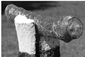
Védett státusz, 2015 (installáció)