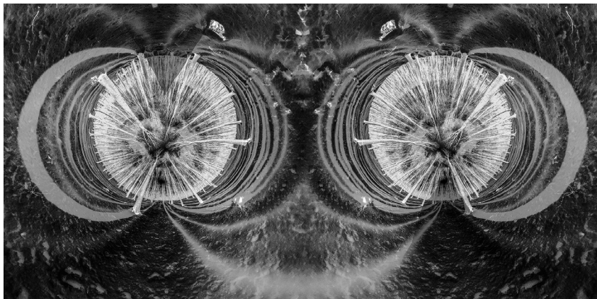
Erővonalak, 2024 (digitális nyomtat, 70 x 38 cm)

Nem véletlen, hogy az önéletrajzi műveknek általában nagy sikerük van – csak egy párhuzamot említenék: Bereményi Géza Magyar Copperfield című önéletrajzi regényét –, mert ezekben a szerző a személyes átéltség révén olyan mélységekbe, a hitelességnek olyan bugyraiba tud lejutni, ugyanakkor egy korszak rajzát is adva alulnézetből, hogy méltán tarthatnak igényt a nagyközönség figyelmére. Ferencz Imre munkája nem ilyen monumentális, nincs is olyan jellegű fikciós keretben elhelyezve, mint a Bereményié, mégis izgalmas: kellően szókimondó, a problémákat, kényes helyzeteket nem elhallgató, változatos életvilágot bemutató (falu–város, gazdálkodó élet emlékei – városi értelmiségi élet valósága), így egy ellentmondásos korszak keresztmetszetét jelentő mű kerekedett ki belőle. A szerző a záró részben (játékosan: Utószó ) is szabadkozik, jelezve, hogy munkája nem szépirodalmi igényű életregény, merthogy ahhoz élet is kell, meg író is: „Jómagam csupán törmelékot hordtam össze, néha egy-egy kanál friss maltert csapva a féltéglák közé”, én azonban úgy vélem, így töredékességében, esetlegességében is kerek és fontos kötet született.