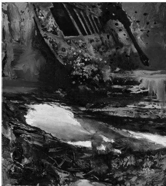
Törött horizontok, 2016 (45 x 50 cm, olaj, vászon)