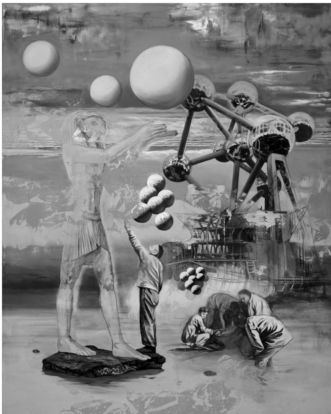
Nem azonos égbolt, 2021 (160 x 200 cm, olaj, vászon)