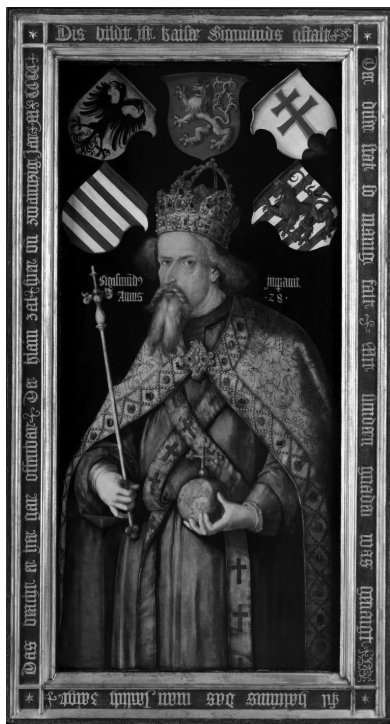
Albrecht Dürer Luxemburgi Zsigmondról készült portréja

Zsigmond mondhatni születésétől fogva egyik – ha nem a legfontosabb – életcéljának tekintette apja koronáinak elnyerését. Ennek első lépéseként megszerezte a magyar Szent Koronát, közel egy évtizedes küzdelem árán biztosította uralmát a királyságban, majd végül itteni uralkodására építve lépett tovább. A magyarországi helyzet rendezése mellett és közben azonban tevélegesen bele kellett szólnia Csehország életébe is. Korán kiderült ugyanis, hogy Zsigmond bátyja, Vencel cseh és német király nem igazán alkalmas az uralkodásra, illetve utódokkal sem fogja megörvendeztetni a világot. Az előbbi miatt a német fejedelmek már 1400-ban megfosztották a német királyi címtől, az utóbbi pedig azzal fenyegetett, hogy a cseh korona is elveszik a Luxemburgi-ház számára. Éppen ezért Zsigmond kezdetektől figyelemmel kísérte, hogy mi történik a szomszédos királyságban, és többször is tevélegesen beavatkozott azért, hogy a cseh koronát megszerezze magának. (Erre végül 1420-ban, Vencel halála után került sor. Időközben azonban sikerült kieroszakolnia, hogy először 1410-ben, majd 1411-ben végérvényesen is megválasszák német királlyá. 1414-ben aztán Aachenben sor került a koronázásra is.) 38 A cseh királyi cím egyfelől azért volt fontos, mert viselője a hét birodalmi választófejedelem egyikének számított, másfelől pedig remek kiindulási pontként szolgált a császári korona megszerzéséhez. Mindez azonban még kevés lett volna, mivel császárrá való ko-