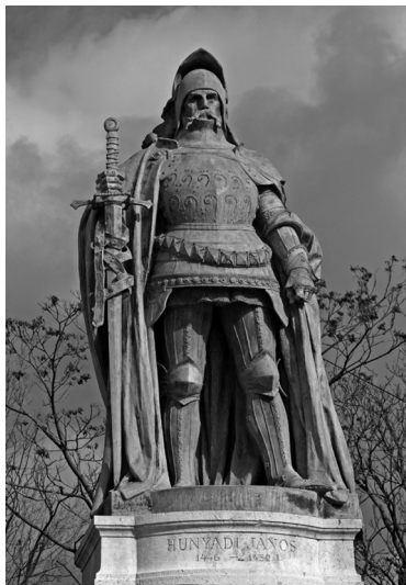
Hunyadi János szobra a Hősök terén (Szobrász: Margó Ede)

kérdéseket. Ami a törökök elleni harcmodort illeti, fontos kihangsúlyozni, hogy a könnyűlovas elem már Hunyadi korában is szerves részét képezte a Magyar Királyság haderejének, és minthogy a családjának birtokai az ország déli határainál feküdtek, nem kizárt, hogy a későbbi hadvezér már ifjúkorától kezdve első kézből származó információkkal bírt a határvidéki oszmán csapatok harcmodjáról. A gyalogság vonatkozásában azt kell megemlítenünk, hogy az 1434-es lipanyi csata után „munkájukat vesztett” huszita zsoldosok szétszéledtek Kelet-Európában. A magyar haderőben való megjelenésük részben ennek tudható be, részben pedig annak, hogy Luxemburgi Zsigmond cseh király is volt egyben. Végezetül – bár erre nem térünk ki bővebben – fennmaradt forrásokból kiderül, hogy Hunyadi a Tallóci-fivérekkel, illetve Filippo Scolari-val is tartott fenn kapcsolatot, és tőlük valóban igen sokat lehetett tanulni a hadvezetés mikéntjéről. Összefoglalva az elmondottakat tehát elmondható, hogy annak a tudásnak és tapasztalatnak a jelentős része, amelyre építve Hunyadi János hadvezéri tehetségét kibontakoztathatta, a korabeli Magyar Királyság területén is rendelkezésre állt.