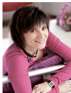
Krizsó Szilvia televíziós újságíró, műsorvezető, szerkesztő