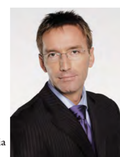
Kotroczó Róbert újságíró, az RTL Klub hírigazgatója