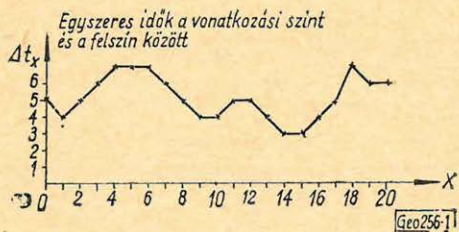
1. ábra ФИГ. 1. Fig. 1.

Ezeket az azonos értékeket a megfelelő x pontban felmérjük a \Delta t_I és \Delta t_{III} értékeket összekötő egyenestől az eltérés irányának megfelelően előjelhelyesen, és így megkapjuk a keresett \Delta t(x) menetet (1/c. ábra).