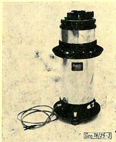
3. ábra. Termosztátos Sharpe graviméter (fénykép).

teljes súly (műszerrel, tápegység nélkül): 8 kp