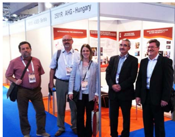
A látogatók egy csoportja az MGE standján

megfelelő szolgáltatást nyújtani a tagjainak ebben a helyzetben, megtartva az eddigi pozitívumokat. Csak a legfontosabb lehetséges utak, amelyeket az EAGE jelenleg követ: a szakmai jellegű oktatás támogatása az egyetemi Local Chapterektől az internetes E-Learningig, a tagság bevonása az egyesületi munkába és támogatása a társult szakmai szervezeteken keresztül. Az EAGE kialakult szervezete kellő háttérrel ad ezek megvalósításához.