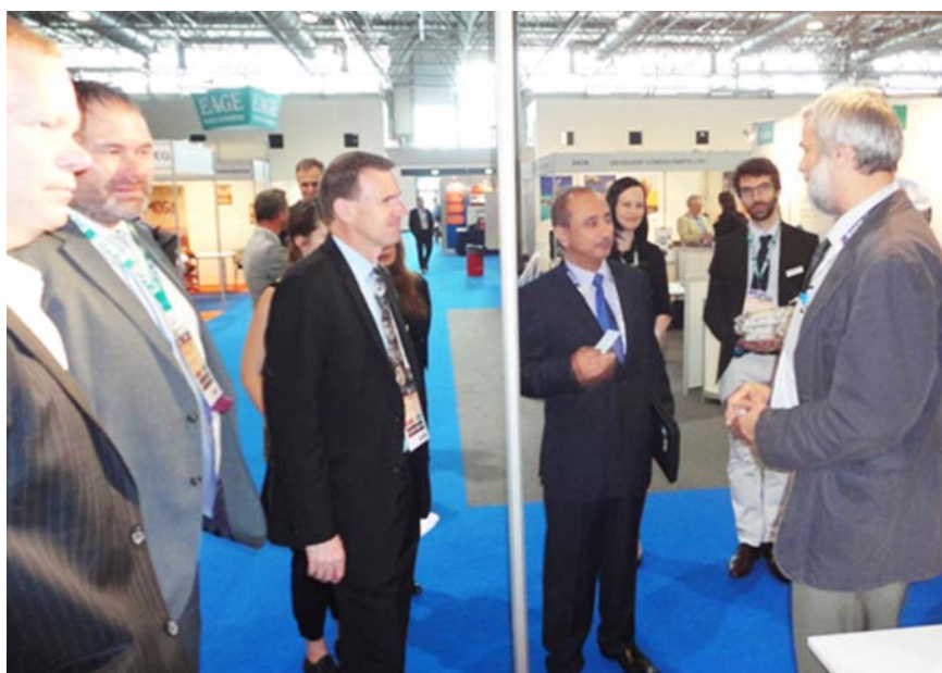
Az EAGE vezetősége az MGE standján