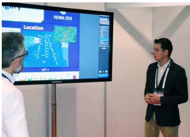
Nádasi Endre E-poszter-előadása Bécsben