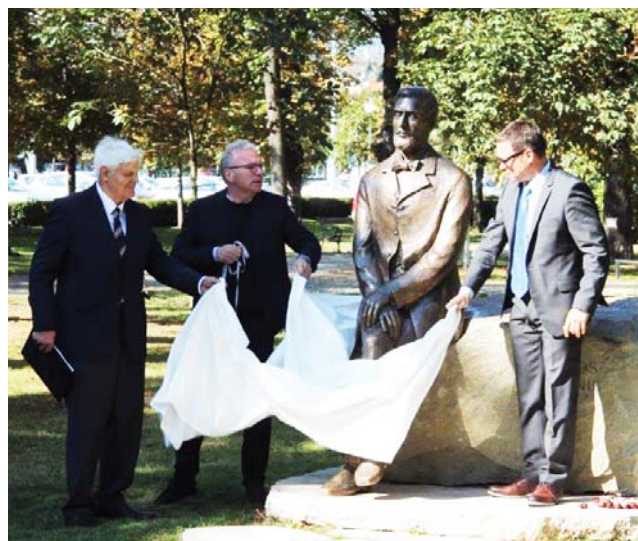
100 év mulasztása! Itt van köztünk Eötvös Loránd!

Csak az az igazi tudomány, amely világra szól, s azért ha igaz tudósok – és amint kell – jó magyarok akarunk lenni, úgy a tudomány zászlaját oly magasra kell emelnünk, hogy azt hazánk határán túl is megláthassák, és megadhassák neki a kellő tiszteletet.