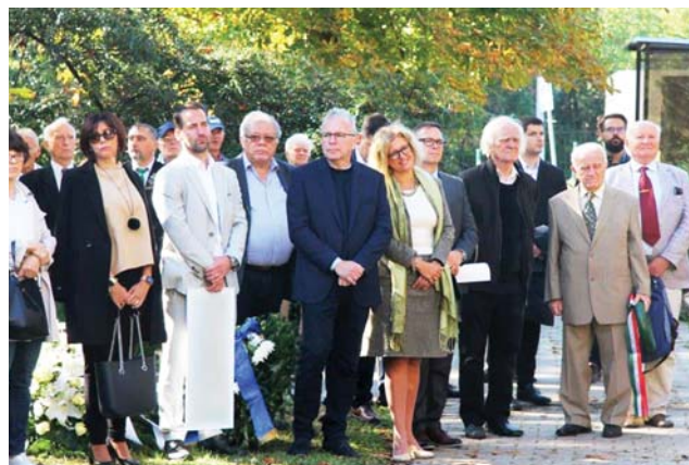
Akik sokat tettek a szoboravatás létrejöttéért

Az avatási ünnepség a Himnusz eléneklésével vette kezdetét. Az ünnepség programját a szobrot állító Alapítvány elnökeként Pályi András vezette. Bevezetőjében kiemelte, hogy a reneszánsz típusú embernek is tekinthető Eötvös Loránd színes egyénisége, céltudatossága, kitartása révén kimagasló tudós, tudományszervező, oktatáspolitikus és oktató, értékeket létrehozó közéleti személyiség, és nagyszerű sportember is volt egy személyben.