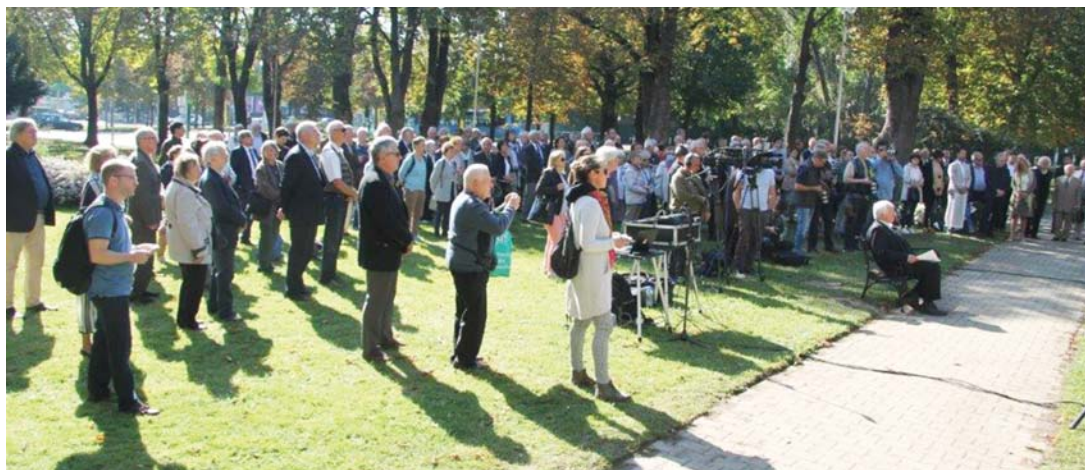
Az ünneplők csoportja

A COVID-19-járvány okozta korlátozások miatt csak megkésve, 2021. október 5-én történt meg a Gesztenyés kertben 1 annak az egészalakos szobornak a felavatása, amelyet az Eötvös Loránd Geofizikai Alapítvány (ELGA) kezdeményezésére és szervezésében és az Innovációs és Technológiai Minisztérium valamint a Hegyvidéki Önkormányzat támogatásával az Eötvös Loránd-emlékév keretében Rieger Tibor Kossuth-díjas szobrászművész készített, világhírű természettudósunkról Eötvös Lorándról.