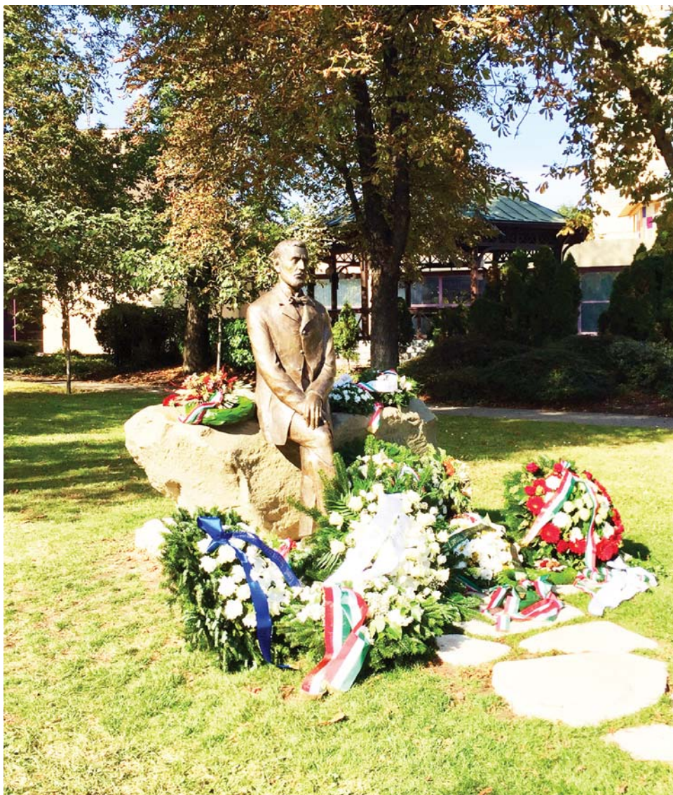
Eötvös Loránd szobra a Gesztenyés kertben

A koszorúzási kör 3 befejezésével az Alapítvány elnöke kérte a még koszorúzni kívánókat, hogy az ünnepség hivatalos bezárását követően helyezték el tiszteletük virágait a szobornál. Majd az ünnepség zárásaként Pályi András megköszönte a megjelenteknek a részvételt és azt, hogy lerótták tiszteletüket Eötvös Loránd emléke előtt. Külön megköszönte a kormányzat és az önkormányzat eredményes támogatását. Háláját fejezte ki mindazoknak, akik sza-