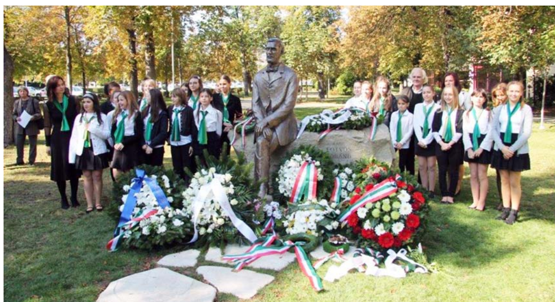
A gyermekkórus és jobb oldalukon hátul a szobrászművész

Az ünnepség üde színfoltjaként ezután, a balatonfüredi Eötvös Loránd Általános Iskola énekkara következett. Az általuk énekelt három kórusmű közül ki kell emelnünk ifj. Somorjai József „Üzenet a kék bolygónak” c. művének előadását. A kórus nagy tetszést aratott, a több mint 150