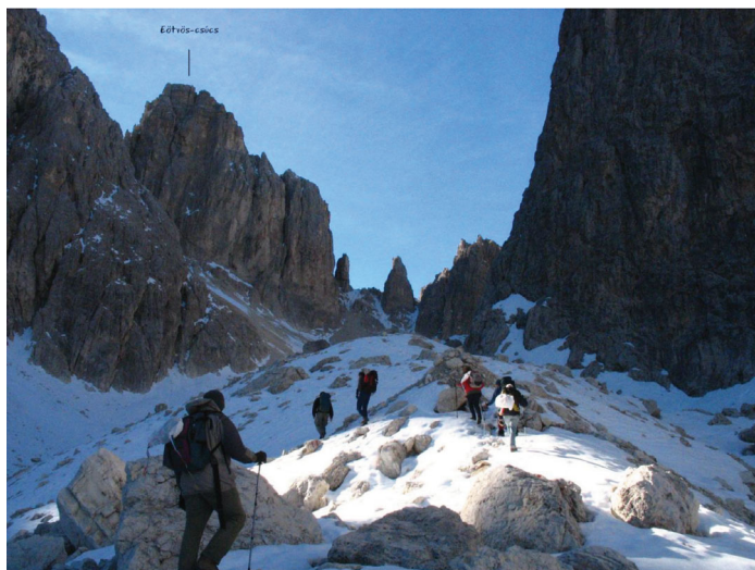
A második kép út felfelé a Rifugio Fonda Savio menedékháztól a Forcella Della Neve hágó felé, illetve az Eötvös-csúcs felé