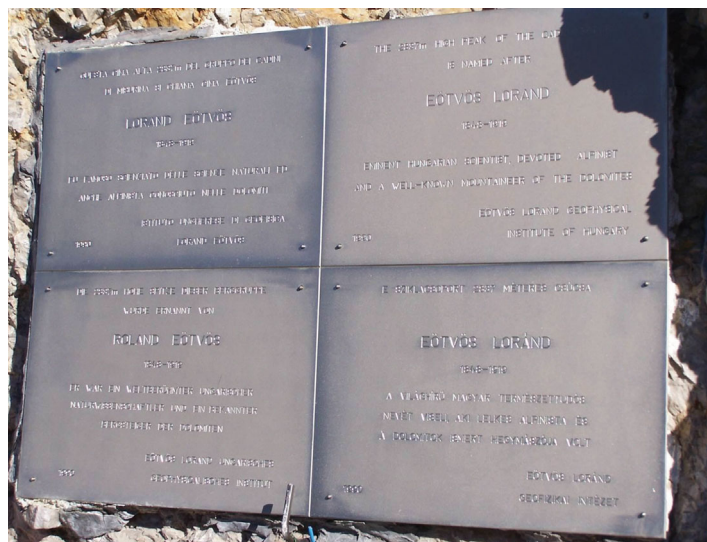
A négy nyelvű (olasz, angol, német, magyar) tábla felhelyezve a sziklafalra