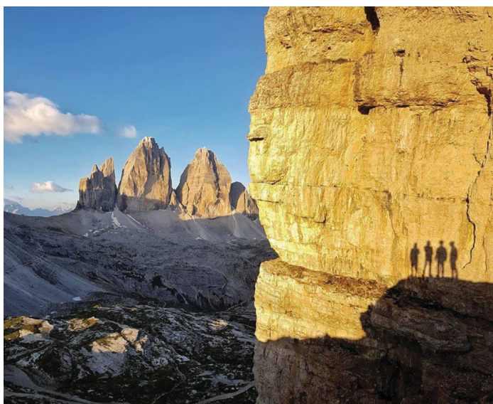
A harmadik kép egy remek fotó a Tre Cime di Lavaredo hegycsoportról, a Cadin-csoport felől fényképezve, négy túrázó árnyékképével, akár mi is lehetnénk