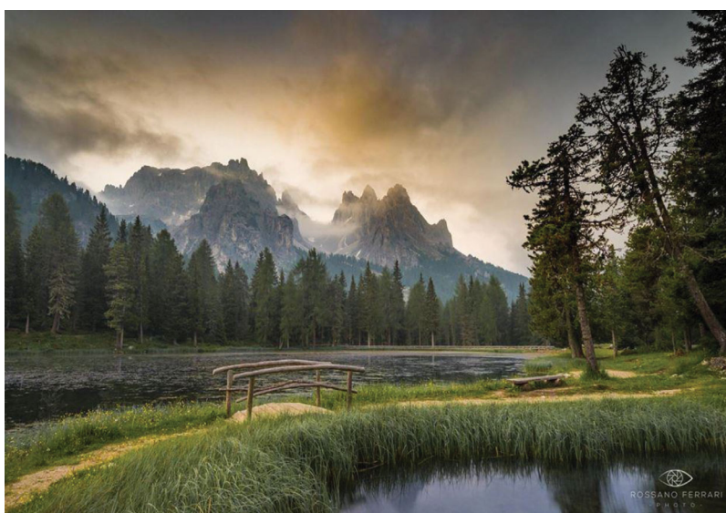
Az első kép a Misurina-tavat és a Cadin-csoportot mutatja, azt a hegycsoportot, ahol az Eötvös-csúcs is található. Ez a kezdőpont az Eötvös-túrahoz