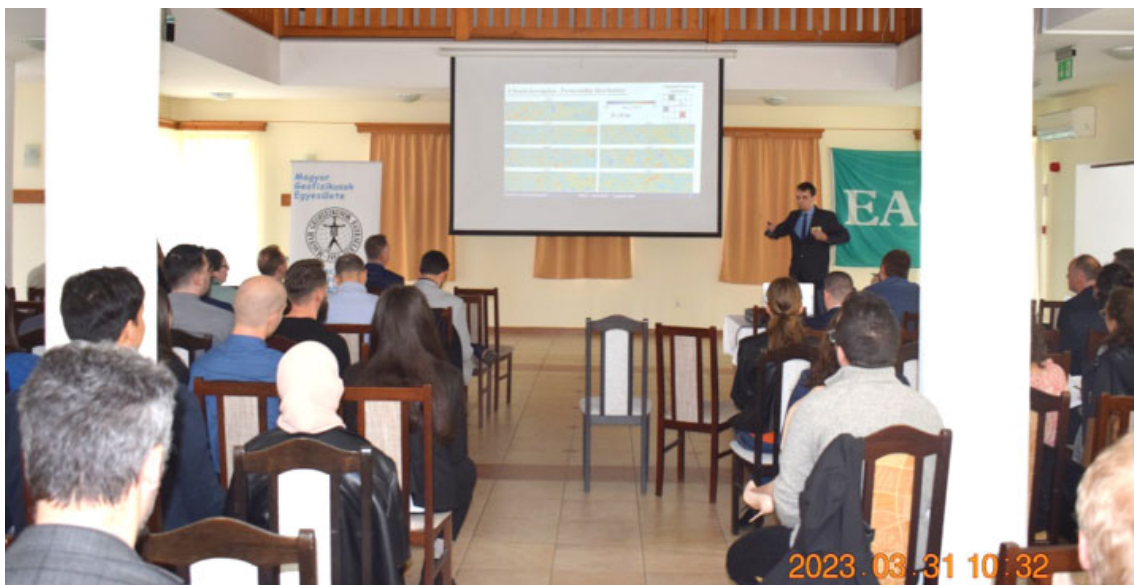
Az előadások helyszíne