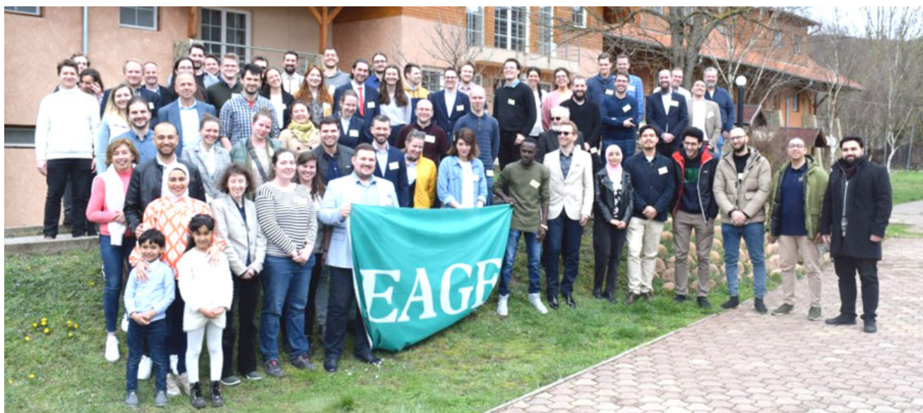
Az ISZA résztvevői Nagybörzsönyben