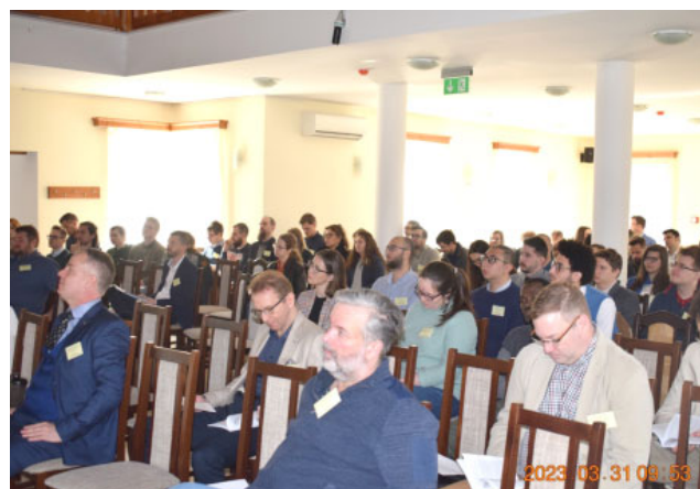
Az előadások hallgatósága