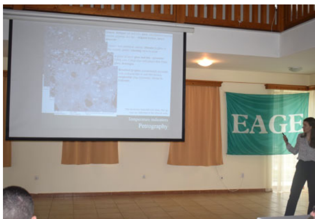
Előadás az ISZA-n