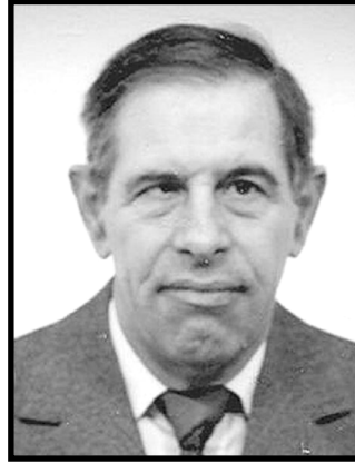
Lantos Miklós 1938 – 2023