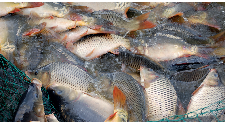
A minőségi magyar hal