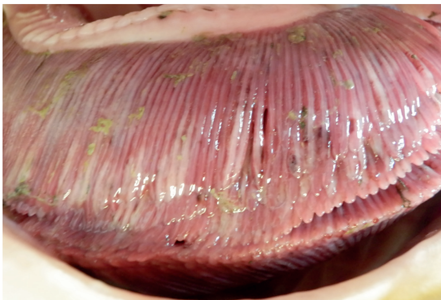
A kopolytún kifehéredett területek láthatók

letek a halgazdák és az érintett állományok 15-90 százaléka elhullott! Négy esetben az ellenőrző vizsgálatra beküldött egészséges hal mintákból mutattuk ki a vírust. A vizsgált halakban bélgyulladás, kopolytú elhalás, a bőrön kiütések, fekélyek, néhány esetben a szemek beesése ( enophthalmus ) volt megfigyelhető. A pontyok testfelületén és a kopolytúkon parazitás fertőzöttség a legtöbb esetben látható volt. A bakteriológiai vizsgálat legtöbbször negatív eredménnyel zárult. A KHV PCR vizsgálat is negatív volt minden mintában.