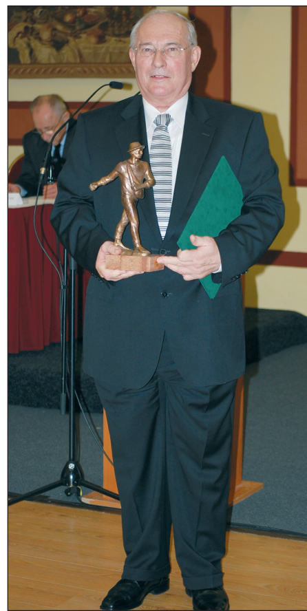
A szobrocska fő helyre kerül a vitrinben