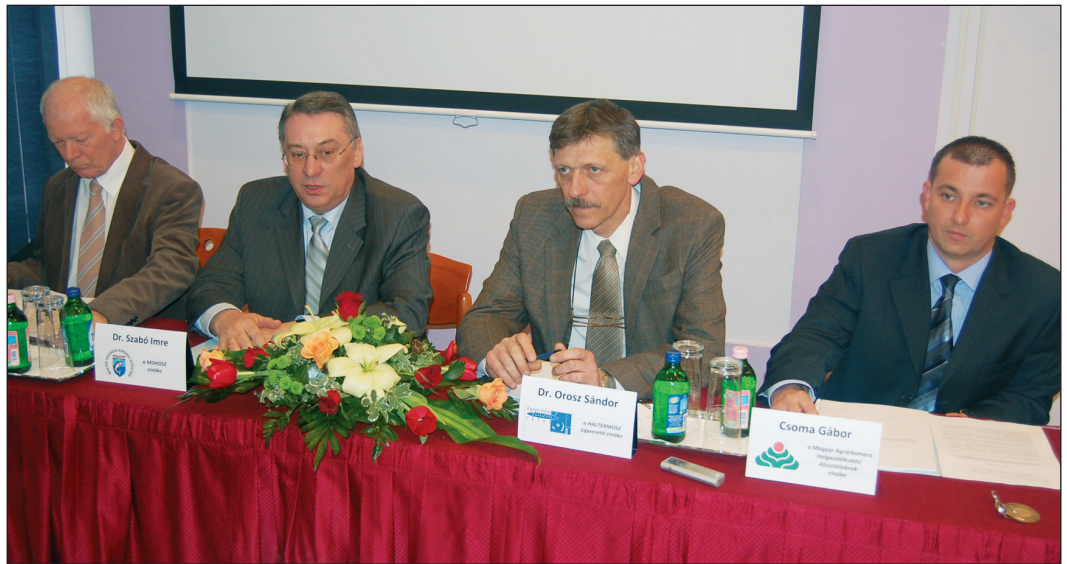
A sajtótájékoztató elnöksége

sa. De addig is szerencsés volna, hogy az FVM visszavonná korábbi közleményét, ugyanis jelenleg mindkét fél árusít a horgászoknak területi jegyeket. A MOHOSZ arra bízta horgászait, hogy az általa kibocsátott területi jegyeket vásárolják, mivel a tó halászati és horgászati hasznosító jogait a szervezet a törvénynek megfelelően gyakorolja. A törvény szerint a MOHOSZ az egyetlen szervezet, amely törvényesen forgalmazhatja az egyesületeken, illetve a jegyforgalmazókon keresztül a Tisza-tóra érvényes területi jegyeket. Az elnök ugyanakkor biztosította a horgászokat, hogy abban a nem várt esetben, ha a bíróság másként döntene, mint ahogyan a MOHOSZ értékeli a jogi helyzetet, és a kft.-t tekintené jogos hasznosítónak, a horgászokat kártalanítják. A horgászokat kár nem érheti, s mindazoknak, akik a