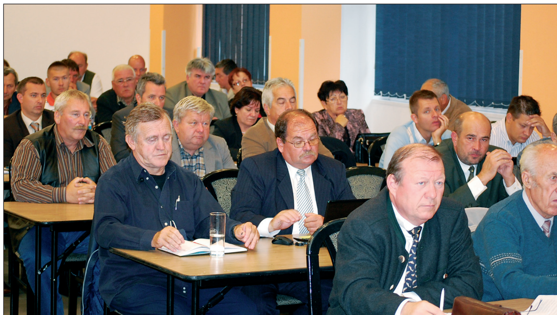
A közgyűlés résztvevői

szervezete, s nem utolsó sorban a működés anyagi-technikai háttere is. Az e kérdésekről szóló vitairatot valamennyi taghoz eljuttatta az előkészítő bizottság; a dokumentumot megvitatta a küldöttgyűlés, a tagozatok taggyűlései, az ügyvezetőség és a felügyelő bizottság is. E fórumokon összesen 42 tag nyilvánított véleményt, és a testületi üléseken e kérdésekben egyhangú döntések születtek. Lényegében a Szövetség megújítása érdekében folytatandó munka alapjául elfogadott