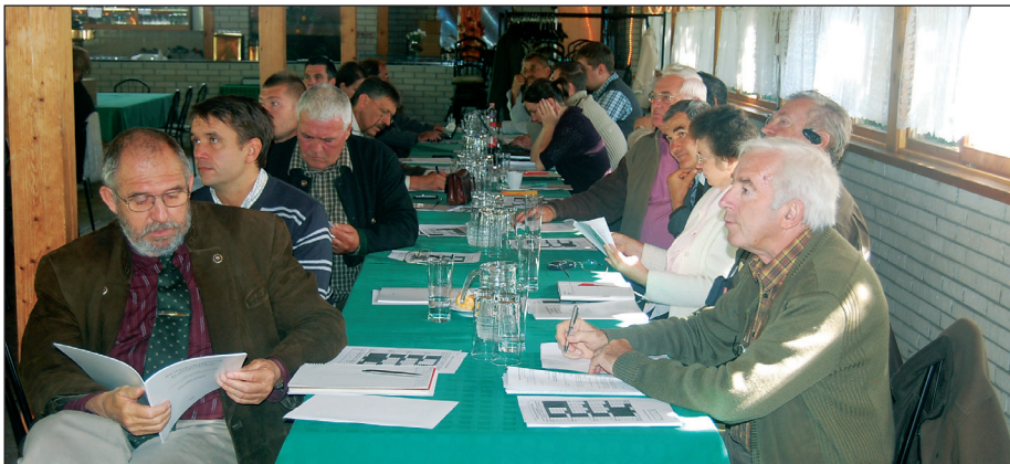
A dinnyési értekezlet résztvevői