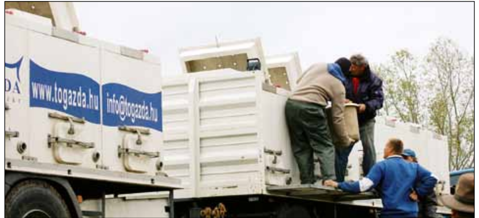
Saját kamionokkal szállítják a halat

A költségekkel kapcsolatban a vezérgazdát elmondta, hogy az elmúlt öt évben – leszámítva az elmúlt hónapokat – alig 5 százalékkal nőtt a hal értékesítési ára, ezzel szemben az input költségek 60–80 százalékkal emelkedtek. Első helyen a gázolaj ára említhető, amely 250 forintról 450 forintra nőtt (és valószínű nem ez a vége), a második helyen pedig a takarmány áll, amelynek mázsánkénti ára 2500 forintról 5000 forintra kúszott. S ha az aszály nem enyhül, akkor a kalászosok ára sem mérséklődik. Egy kilogramm halhús előállításához 3–5 kilogramm takarmányra van szükség, ezért a hal árát is nö-