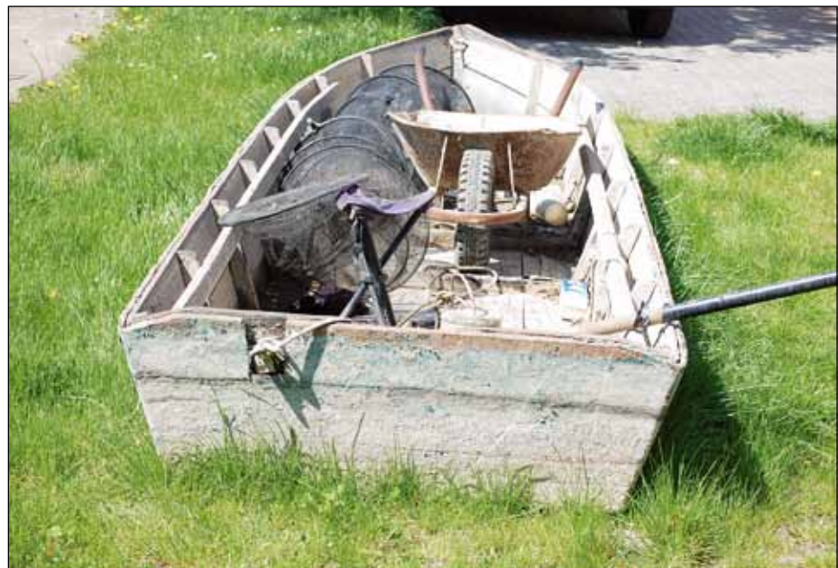
Egy jól felszerelt rapsics csónak. Ezzel már biztosan nem lopják a halat

Az utoljára elfogott, lőfegyverrel felszerelt, szervezett, hálózó rablóbandán négy éve ütötte rajta, mégpedig Ráckeve környékén. Jelenleg is a bírósági szakaszban van az ügy, bár rész-ítéletek vannak, ezek szerint nem csak pénzbüntetésre, hanem felfüggesztett börtönbüntetésre is ítélték az elkövetőket. Szervezett, hálózó rablóbandáról jelenleg nincs tudomásuk. A felderített ügyeknél – legalább is ez az utóbbi három év tapasztalata – a bíróság egyre szigorúbb, elrettentőbb ítéleteket hoz. Szigorítottak a büntetések minőségén, s már nem kezelik szociális bűncselekménynek a hallopást, legyen szó akár csak néhány kilogrammról. Az igazgató is úgy véli, hogy az új Büntető Törvénykönyvben – amely jelenleg még csak tervezet, de várhatóan 2013. január elsejével lép hatályba – megfelelő szigorral szankcionálják a hallopást, de a helyes arányokat itt is meg kell találni. Magyarán, az elkövetők anyagi helyzetét is figyelembe vevő bírságok kiszabása indo-