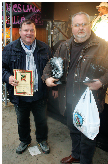
A győztes csapat, a Baja Marketing Kft.