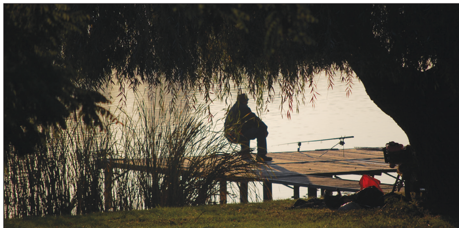
A természetes vízparton a horgász az úr

dés nem szűnik meg azonnal, a halgazdálkodási jog továbbra is gyakorolható, csak a haszonbérleti szerződés lejártá vagy megszüntetése után érvényesül, hogy a különleges rendeltetésű nyilvántartott halgazdálkodási vízterület halgazdálkodási joga vagyonekezelési szerződéssel kerül egy költségvetési szervhez vagy 100 százalékos állami tulajdonban lévő gazdálkodó szervezethez. Ilyen esetben is megilleti kártérítés a korábbi hasznosítót (haszonbérliőt).