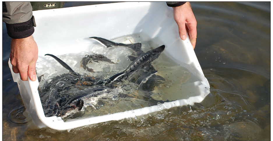
Kecsgetelepítés a Dunába

– A megyében sok kis egyesület működik, zömük zárt vízben gazdálkodik. Összességében 12 ezer regisztrált horgász van a megyében, s közülük 4-5 ezer a mi vízünkön is horgászik. A fogási naplók tanúsága szerint évente 180-220 mázsa halat fognak ki. A természetes vízi árbevételünk